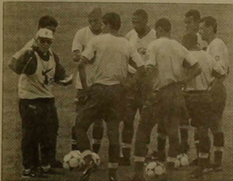
Ֆուտբոլիստներն առելու բան ունի Բրազիլիայի հավաքականի մարզիչ Չազարե

Օրերս հայտնի դարձավ, որ Անգլիայի հավաքականի անդամ, «Արսենալ» թիմի 34-ամյա Իան Ռայթը եւս վնասվածի դեմ դաստիարակվածից աշխարհի առաջնությանը: Ֆրանսիայում հանդես չի գա անգլիացի նաեւ մեկ այլ հանրաճանաչ ֆուտբոլիստ, մարզատեղերի դաստիարակ Պոլ Պասկոյը: Եւ խաղում էր Շոտլանդիայի «Գլազգո Ռեյնջերս» թիմում, առաջ եղած փոփոխվեց անգլիական «Միդլսբրո», սակայն երկար ժամանակ խաղադաս դուրս չէր գալիս: Վերջերս Պասկոյը, որին փաղափարում էր «Գազզա» են անվանում, կրկին հայտնվեց իր երկրի հավաքականի թեկնածուների կազմում, սուղաղական խաղերին մասնակցեց: Սակայն թիմի գլխավոր մարզիչ Գլեն Հոլլը նրան չընդգրկեց հավաքականում: Այս որոշումը երկուստեքի բացասական վերաբերմունքն առաջացրեց: Իսկ ֆուտբոլի վեցերորդ Բրիս Ռոդըն ասաց. «Դա կտղանի Գազզային, հանուն ֆուտբոլի է նա աղաթում»: