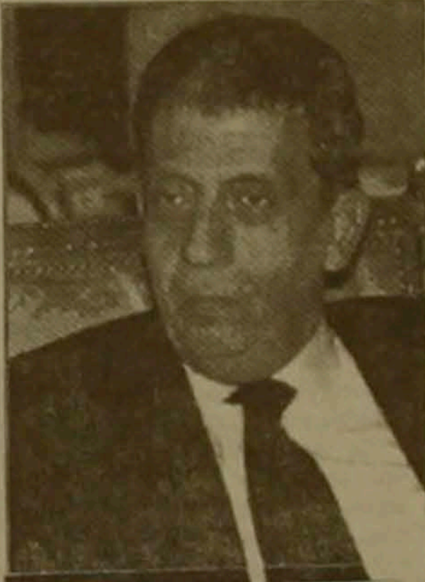
ԱՄՆ-ը, որ վիճաբանող կողմերը հաշտության եզրեր փնտրել:

- Մ Լահանգները նախաձեռնություններ իր ձեռքում է վերցրել: Միջին Արեւելում բոլորը գիտեն, թե ինչ է