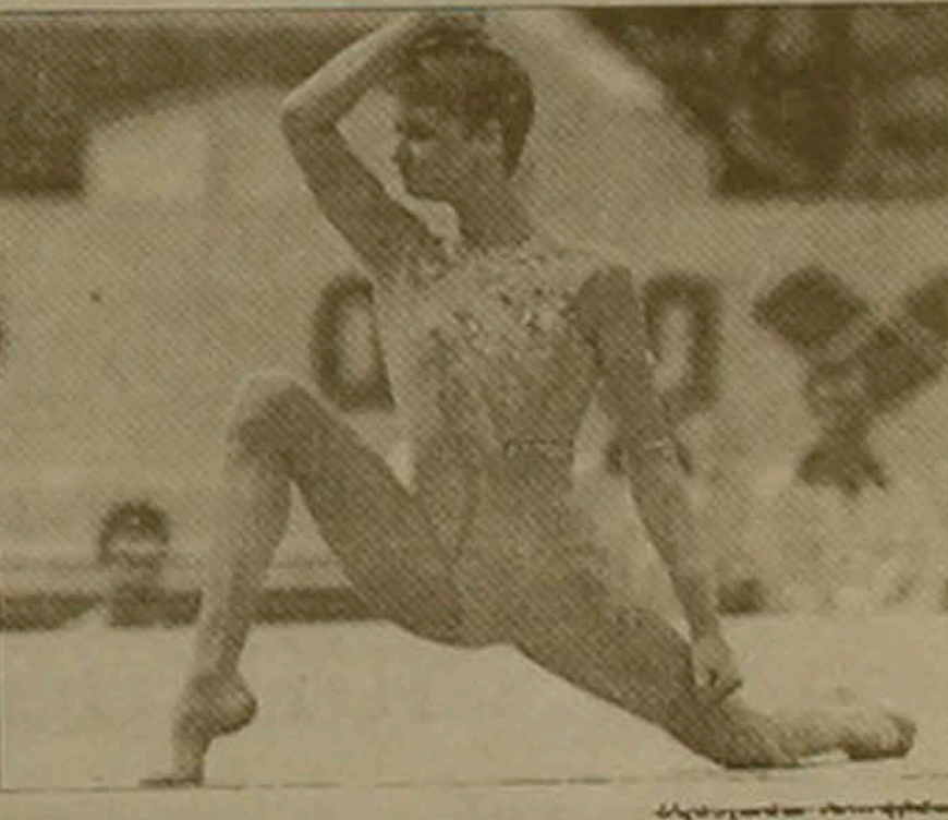
Վերջինս մրցումներում հաղթեց Ռուսաստանի մարմնամարզուհիները միայն չեղեցին տեղ գրավեցին: Չեմպիոնուհիներ դարձան Ուկրաինայի մարզուհիները, իսկ մրցանակային երկրորդ եւ երրորդ տեղերում են համադասարանաբար Ռուսիայի եւ Իտալիայի ներկայացուցիչները:

Սանկս Պետերբուրգում ավարտվեց սպորտային մարմնամարզության եվրոպայի առաջնությունը: Տղամարդկանց մրցումների մասին արդեն հայտնել են: Կանանց մրցադարձի առաջին օրը խոշոր անակնկալ գրանցվեց երիտասարդական թիմային մրցումներում նախորդ առաջնության հաղթողները Ռուսաստանի մարմնամարզուհիները միայն չեղեցին տեղ գրավեցին: Չեմպիոնուհիներ դարձան Ուկրաինայի մարզուհիները, իսկ մրցանակային երկրորդ եւ երրորդ տեղերում են համադասարանաբար Ռուսիայի եւ Իտալիայի ներկայացուցիչները: Կանանց առաջնությունում հաղթեց Ռուսիայի հավաքականը, որն իրենից հետ թողեց Ռուսաստանի եւ Ուկրաինայի մարմնամարզուհիներին: Սակայն Ռուսաստանի մարզուհիները հիանալի հանդես եկան անհատական մրցումներում: Բազմամարտի չեմպիոնուհու մեծ ոսկե մեդալը նվաճեց Ալեքսանդրայի օլիմպիադայի հերոսուհի Սվետլանա Խորկինան: Երկրորդ եւ երրորդ տեղերը գրավեցին ռուսիանուհիները: