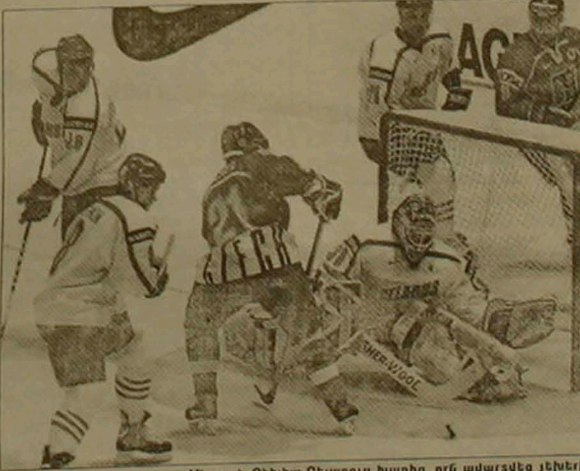
Մի դրաի Չեխիա-Բելառուս խաղից, որն ավարտվեց չեխերի հաղթանակով 4-2 հաւճով:

կանությանը, հենց նրանք էլ հաջորդ փուլ դուրս կզան: Ի դեպ, 2-րդ տուրում նրանց հանդիպումը ոչ ուի 2-2 ավարտվեց: Սա շատերը անակնկալ համարեցին: Իսկ ինչպե՞ս անվանել «Շ» խմբի ԱՄՆ-Ֆրանսիա հանդիպման ար