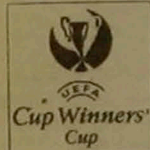
UEFA Cup Winners' Cup

Գավաթակիրների գավաթի կիսաեզրափակչի պատասխան խաղերը