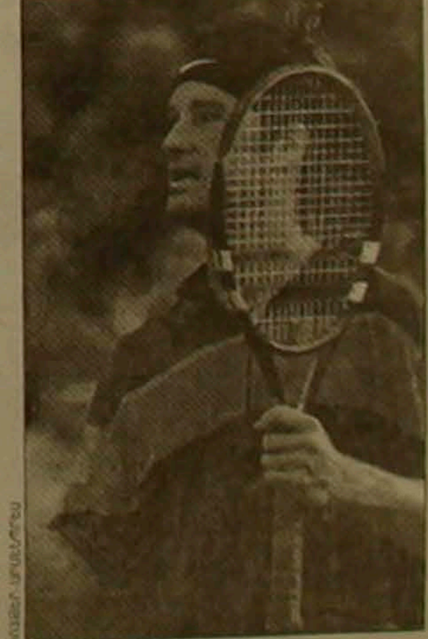
Բարսելոնի մրցաշրջանում հաջող է խաղում իտալացի Կառլոս Սոյան

Բարսելոնում բոլոր երեք խաղերն իր օգին է ավարտել եվգենի Կաֆեյնիկովը: Վերջին խաղում նա 7-6, 3-6, 6-1 հաշվով դարձապատի մասնակց իտալացի Կառլո Սուլլոյին: Սակայն հաղթանակները դժվարությամբ են սրվում ռուս թենիսիստին: Քառորդ եզրափակչում նա ժեթ է հանդիպում մեկ այլ իտալացու՝ Ալբերտո Բեասասեգիի հետ (վերջինս 3-րդ փուլում հաղթել է իր հայրենակից Ալբերտո Կոստային): Երկրորդ օրը նա անհաջողության մասնակցեց Ռուսաստանի մեկ այլ ներկայացուցիչ՝ Մարաս Սաֆինը: Նա 4-6, 6-3, 2-6 հաշվով զիջեց Կառլոս Կոստային: Զավորիտ համարվող թենիսիստներից հաջող է հանդես գալիս Թոմաս Մուսթերը (Սվաբիա): Իսկ իտալացի Ալեն Կարեսյան դարձապատի կրեց իտալացի Անդրեա Գաուդենցիից: