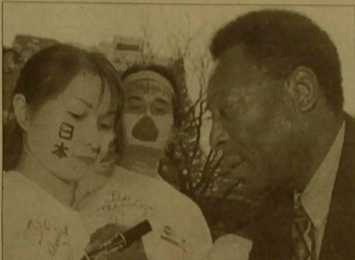
Պեյեն ձառողջ երեսուցյա ֆուտբոլիստների հետ

«Ես կարծում եմ, որ ֆուտբոլի միջազգային ֆեդերացիայի նախագահի դառնումը չդիմացնում է համարյա թե ցմահ մնա միևնույն մարդը: Ամերիկացի է ռուսացի մեջքով, այսինքն այնպես անել, որ համախառնապես ֆուտբոլը փոխմիտոս դեկլարենք բոլոր երկրների ազգային ֆեդերացիաների ներկայացուցիչները», վերջերս հայտարարել է բոլոր ժամանակների լավագույն ֆուտբոլիստ, ներկայումս Բրազիլիայի սպորտի նախարար Պեյեն: Ես մեկն եմ առաջիններից, ովքեր հանդես են գալիս ՖԻՖԱ-ի արմատական վերափոխման համար: Դրանով իսկ նա առաջացրեց միջազգային ֆեդերացիայի նախագահ, քաղաքացի ժողովակցի ղեկավարությունը: