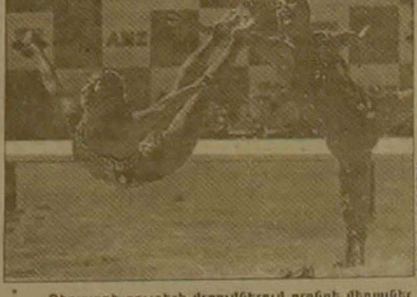
Ղեկավարող զույգերի մրցումներում բռնվեց մեդալներ Եվրոպայի մարզիկներին:

Ավստրալիան մոտենում էր Եվրոպայից հաղթողը և կամեցավ առաջնությունները: Կամեցավ մրցաբարում արդեն հայտնի են եզրափակի մասնակիցները: Կիսածուրդի մեկնարկի խաղերից մեկում Հունգարիայի հավակնականը 7-5 հավելով հաղթեց Ռուսաստանի թիմին, մյուսում իսպանուկները 10-9 հավելով տարտուրան մասնցին Ավստրալիայի մարզուկներին: Այժմ ջրազնայի աշխարհի չեմպիոնուիկների կոչումը կիսատրվեն Իտալիայի ու Հունգարիայի հավակնականները, իսկ երրորդ տեղի համար կմրցեն Ռուսաստանի ու Ավստրալիայի թիմերը: