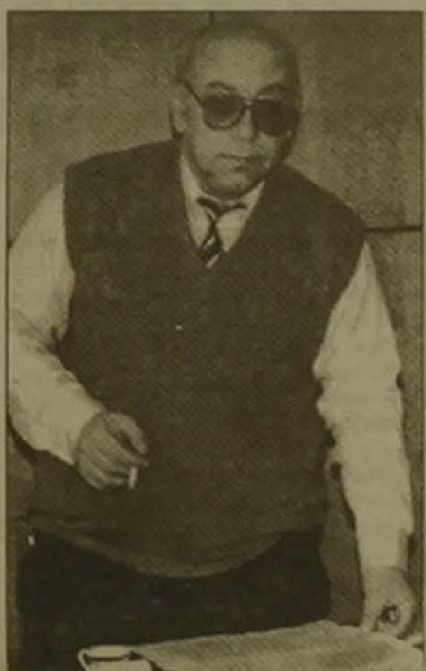
Ձեռք համախոս ընտրությունը կատարվում է ոչ թե «լավի եւ վատի», այլ «վատի եւ ավելի վատի» միջոցով: Վեր

Հարցազրույց ՀՈԱԿ առաջնության հարցազրույցի հետ