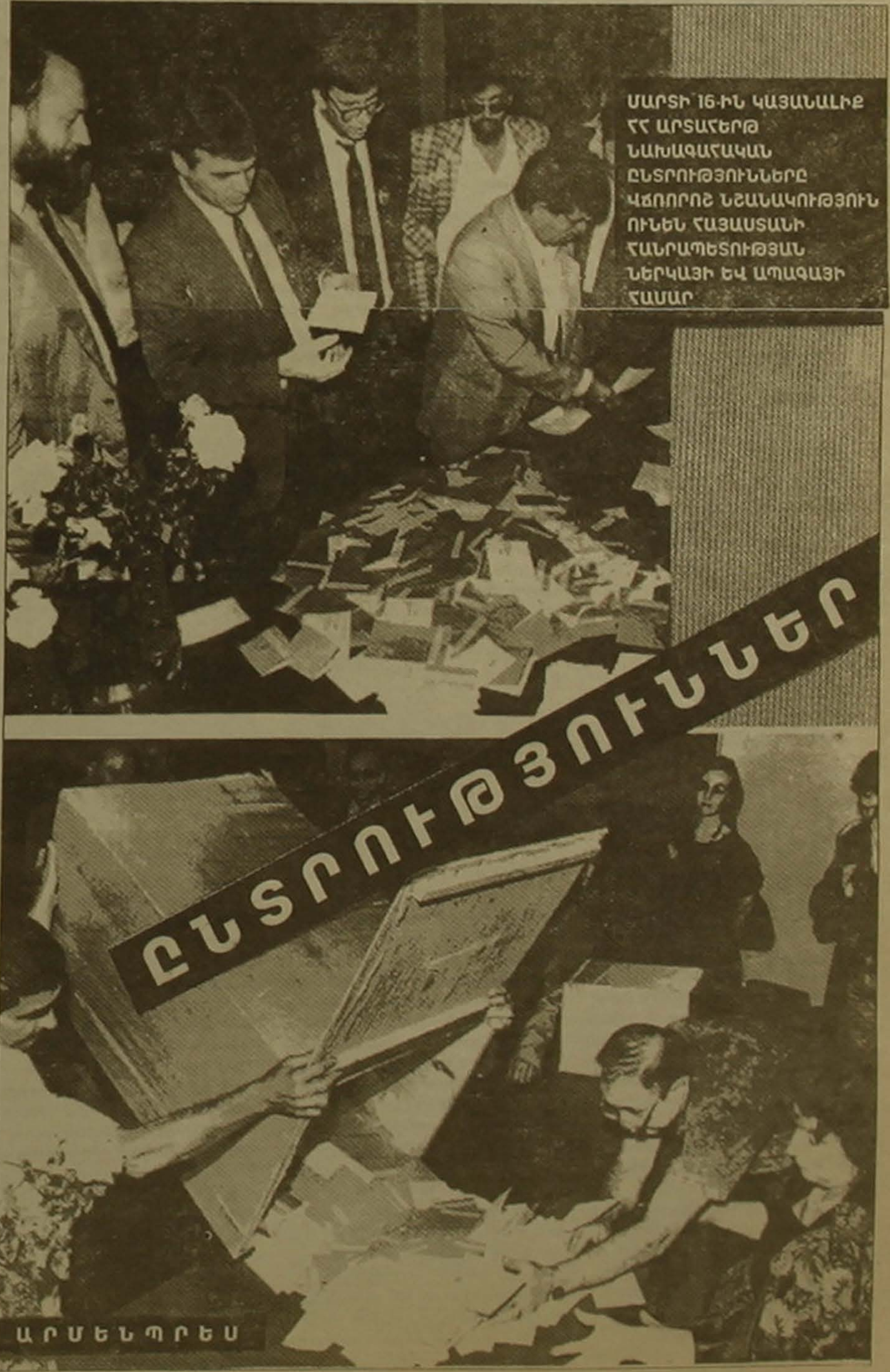
ՄԱՐՏԻ 16-ԻՆ ԿԱՅԱՆԱԼԻԷ ՀՀ ԱՐՏԱՀԵՐԹ ՆԱԽԱԳԱՀԱԿԱՆ ԸՆՏՐՈՒԹՅՈՒՆՆԵՐԸ ԿՈՒՐՈՋ ՆՇԱՆԱԿՈՒԹՅՈՒՆ ՈՒՆԵՆ ՀԱՅԱՍՏԱՆԻ ՀԱՆՐԱՊԵՏՈՒԹՅԱՆ ՆԵՐԿԱՅԻ ԵՎ ԱՊՍՏՈՅԻ ՀԱՍԱՐ

Քննարկմանն աջակցել և ներդրի հրահանգությունը ֆինանսավորել է Ընտրական համակարգերի միջազգային հաստատության (IFES) երեւանի գրասենյակը: Ներդրում օգտագործված են Արմենյոն լրատվական գործակալության ֆոտոխրոնիկայի լուսանկարները: Շնորհակալություն ենք հայտնում IFES-ին և Արմենյոնի ֆոտոխրոնիկային աջակցության համար: