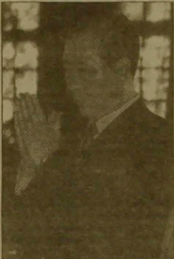
միայն Ասիային, այլեւ ԱՄՆ-ին ու Եվրոպային:

Իով կորեական վոնի փոխարժեքը դուրսի նկատմամբ կիսով չափ նվազել է: Երկրի ֆինանսների նախարարությունը դեկտեմբերի վերջերին ստիպված եղավ խոստովանել, որ կորեական ձեռնարկությունները եւ դրանց արտասահմանյան մասնաճյուղերի դարձրելու հասնում է 200 միլիարդ դոլարի, այսինքն երկրի մեկ բնակչի հաշվով կազմում է 4000 դոլար: Պարսփի սոկոսների դիմաց 1997 թ. վերջին դեպք է վճարվել 15 մլրդ դոլար, 1998 թ. հունվարին եւս 15 մլրդ: