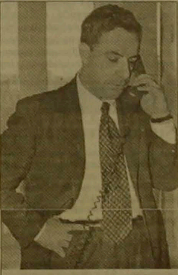
Սակայն ցաս դեղիերում մեկնայար, առանց լուրջ ուսումնասիրության եւ համակարգման: Ցավոք, այդ իրավիճակն աննկատ չմնաց

Իրո՞ք, ժամանակ առ ժամանակ կարող է թվալ, որ Եվրոպական ուղղությունը Չայասանը արտարիս ֆադակաձնության մեջ թե սեականորեն եւ թե գործնականում գրեթե ձեւավորված չէ, որ բացակայում են նդասակները եւ դրանց կենսագործման հսակ ձեւակերպումները, որ կոնցեդտուալ դուրյոները կրում են դասահական եւ դեկլարաիվ բնույթ: Աշխատանքը Եվրոպական ուղղությանը, իհարկե, տարվում էր,