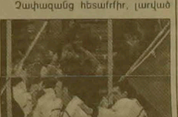
Չեյն հոկեյիստների տասնվեց ցրանը

Չափազանց հեծաբիր, լարված իսկ Յան Յանին թողնելով արժանի մեդալակիր դարձավ նաեւ այլ կորեուհի Գի Կյունգ Կունը: Տղամարդկանց 5000 մ փոխանցումով կազմակերպվել են սույն մեդալները: Եվ արժանի մեդալները համադասախանաբար Եւրոպայի, Կորեայի եւ Գերմանիայի չեմպիոնները: