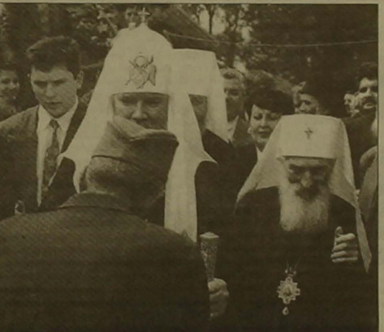
Քյոպրուկի սերբերը Գրաչանիցա վանքի բակում աղոթաբով են դիմադրում համայն Եվրոպայի դասրիարհ Պալեիին եւ Ռուսաստանի դասրիարհ Ալեկսի Եվրոպիին: