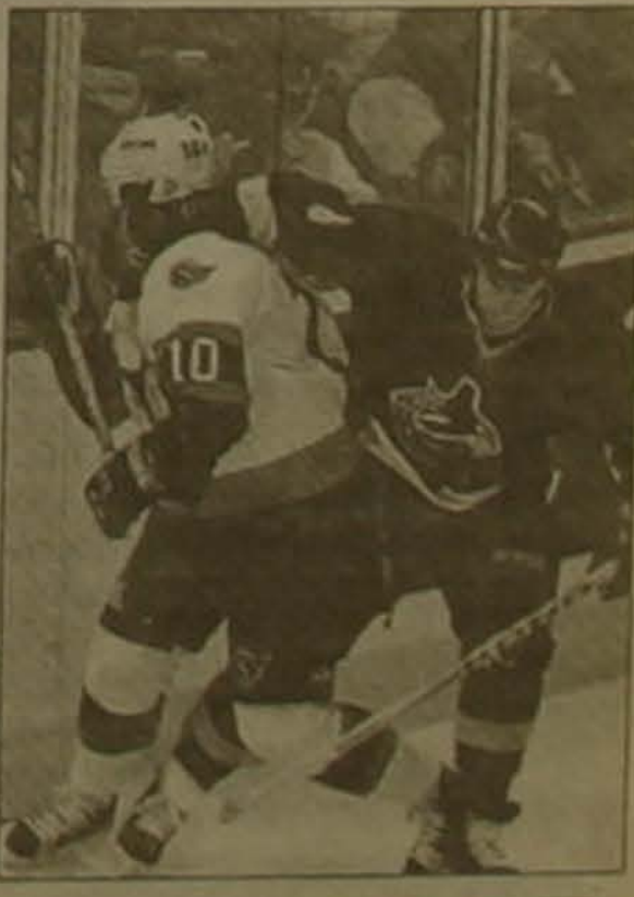
Քոնկոնի Վանկուվերը հաղթեց Ֆլորիդային:

Հոկեյի ազգային լիգայի (NHL) առաջնության մասնական փուլում ժայթարը գնալով թեմանում է: ԱՄՆ-ի եւ Կանադայի 23 թիմեր հինգ խմբերում մրցում են հաջորդ քաղաք մտնելու համար, ինչը հնարավորություն կտա ժայթարը շարունակել դաշտավոր մրցանակի՝ Սթենլիի գավաթի համար: Թիմերն անցկացրել են անհավասար թվով խաղեր (16-ից 22), սակայն որոշվել են առաջատարներն ու վերջապահները: Ներկայացնենք վերջին տուրի հանդիպումների արդյունքները: «Տորոնտո»-«Վանկուվեր» 5-1, «Ֆլորիդա»-«Քոնկոն» 0-1, «Դալաս»-«Նյու Յեյքսի» 2-5, «Կարոլինա»-«Ման Նոսես» 3-0, «Այլենդերս»-«Ֆիլադելֆիա» 4-2, «Բաֆալո»-«Ռեյնջերս» 4-2, «Վաշինգտոն»-«Պիտսբուրգ» 5-4, «Դետրոյթ»-«Մանհայմ» 5-2, «Էդմոնտոն»-«Կոլորադո» 3-0, «Նեվադա»-«Կալիֆորնիա» 4-3: