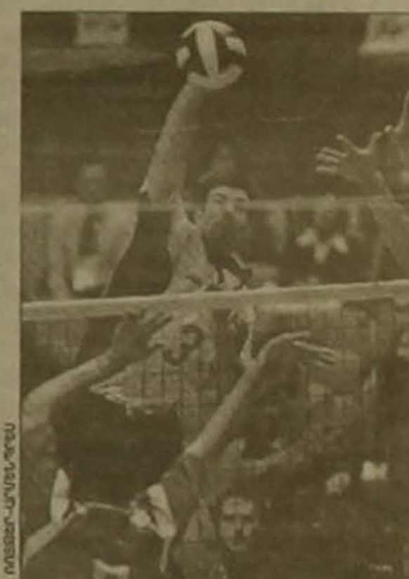
Իսթանբուլի Կուրա-Իսթանբուլը հաղթեց Իսթանբուլի Կուրա-Իսթանբուլին:

Ճաղոնիայի Օսակա եւ Համամացու Բադաներում շարունակվում է աշխարհի տղամարզկանց առաջնությունը: Տեղի ունեցան երկրորդ փուլի մրցավեճերը տուրի հանդիպումները, որոնց արդյունքները ներկայացնում են ընթացողների ուսուցչությանը: «Գ» խումբ. Կուրա-Իսթանբուլ 2-2, Բրազիլիա-Արգենտինա 3-1, Բուլղարիա-Հարավային Կորեա 3-1, Կանադա-Ճաղոնիա 3-1, «Ի» խումբ. Հարավային Իսպանիա 3-0, Ռուսաստան-Հոլանդիա 3-0, Չինաստան-Ուկրաինա 3-1, ԱՄՆ-Հունաստան 3-0: Թիմերը եւս մեկական խաղ կանցկացնեն, որից հետո հայտնի կդառնա ժայթարը շարունակող խոյակը: Առայժմ կիսանգրավակիչ փուլի իրավունք է նվաճել «Գ» խմբի առաջատար Բրազիլիայի հավաքականը: Այդ խմբի երկրորդ ուղեգրին հավակնում են Կուրայի եւ Իսթանբուլի վոլբորդիստները: «Ի» խմբում հավակնորդներն ավելի շատ են: Առաջին եւ երկրորդ տուրի համար ժայթարում են Հարավային Իսպանիայի, Ռուսաստանի եւ Հոլանդիայի հավաքականները: