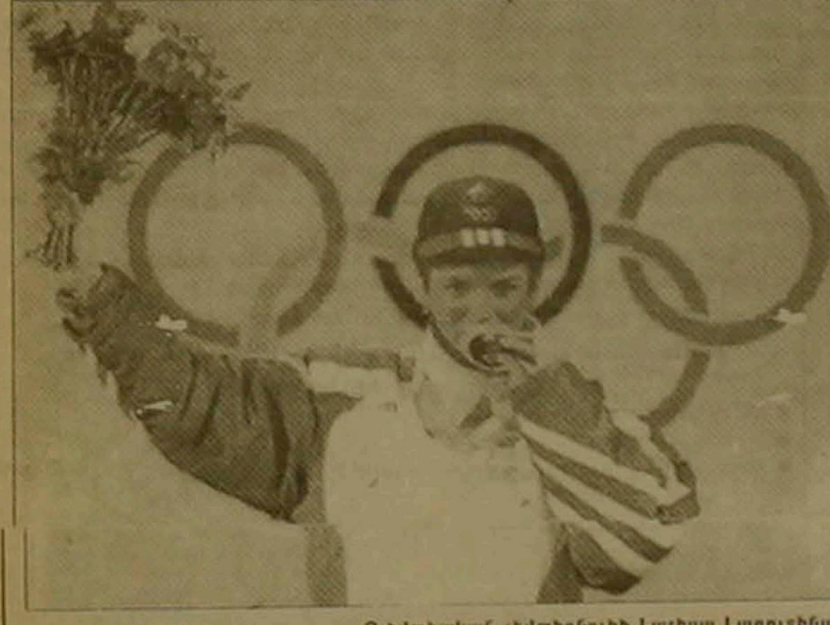
Օլիմպիական չեմպիոնուուու Լարիսա Լազուսինան

Չափազանց առատ տեղադրված ծյան թասնառով կազմակերպիչները մի փանի անգամ հեռավոր էին լեռնադահուկային սորոսի մեկնարկները: Եվ միայն երեկ հնարավոր դարձավ սկսել այդ մրցումները: Այստեղ կոչված ալիմպիական երկամասում առաջին տեղից են ընթանում Մարիո Ռայսերը (Ավստրիա): Լուստե Կյուրը (Նորվեգիա) և Անջել Բալսլեդան (Լեհաստան) իսկ չեմպիոնը հայտնի կդառնա այսօր: