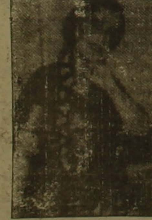
Վերադասարտվելու կրթաբուժակ: Ային Բուրբանը հաղթող էր ծանուցվել Այու Յուրի Տուր Լոնդոն մրցում, հաղորդում է «Ամինն Սիսիարյան» շերմեստույում:

Երեսնաների ստորան Ային Բուրբանը ծայրերի ջախջախիչ մեծամասնությամբ արժանացել է Կանադայի երիտասարդ կատարողների ժողովրդական մրցանակին, որը ներառում է իրից հազար դոլարի դրամական դյադա եւ Ֆլորիդայի գրանտ օմբրայի դերակատարման ստուդիայում