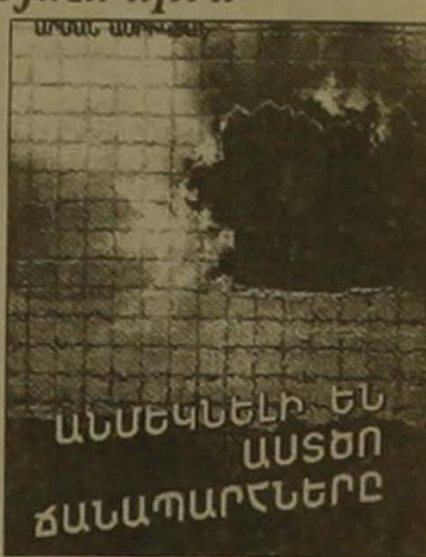
Անխախտ կմնա կառուցումն այս մեծ.

Կարող եմ անցնել փորձերին էլ, Անցել են ինչպես մրրկներ բազում,