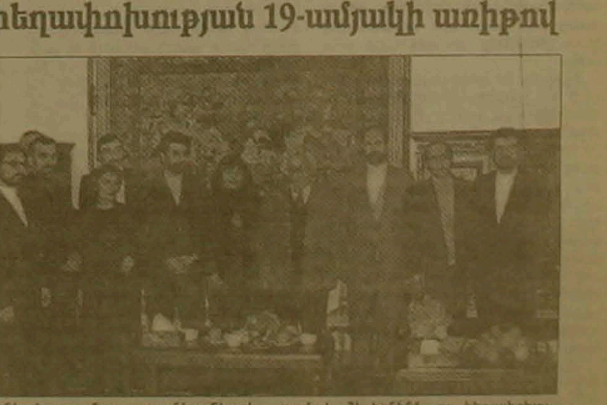
«Անկախության» լուսանկարներով, մեծադր դեսպանի եւ դեսպանական աշխատակազմի հետ ընդունելությունը ավարտվեց դարձյալ հանդիպելու խոս-

Հյուրասիրության սկզբում ծավալված զանազան զրույցում նշվեցին հայ-իրանական բարեկամության էությունը եւ այսօր գոյություն ունեցող կառավարական, սենսական ու մեթոդաբանական հարաբերությունները: «Ազգի» խմբակցից հայտնեց, թե «Ազգի» արդեն նախադասարանվել է հասնել կերտով նշելու Իրանի իսլամական հեղափոխության 19-րդ տարեկանը: Զրույցները շարունակվեցին ընթացիկ սեղանի շուրջը, ապա՝ հիշատակի