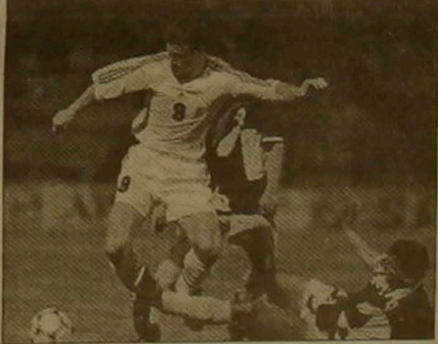
Պահ ԱԵԿ-«Ֆեյենդադաբո» խաղից

Վիլնյուսի «Ճալգիրիսը» ոչ մի կերտ չկարողացավ հաղթահարել Նուրվեգական «Բրանն» թիմի տասնամյակային Ռ-Օ: Իսկ քանի որ առաջին խաղում նուրվեգացիները հաղթել էին 1-0 հաշվով, հեյս նրանք էլ կասունակեն տայֆարը: