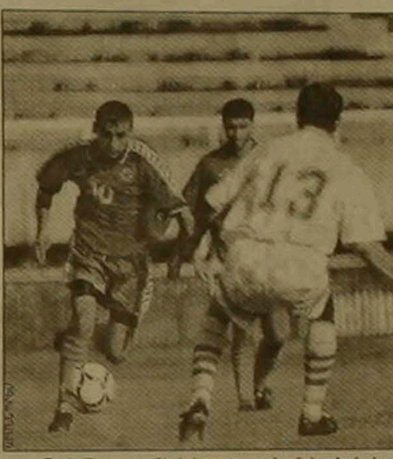
Պահ Հայաստանի երիտասարդական հավաքական Լիբանանի ազգային հավաքական խաղից

- Հայաստանի և Լիբանանի միջև մի օրով մեր հարաբերություններ են եղել, ասաց դեսպանը, եւ այժմ էլ դրանք ակտիվորեն եւ դինամիկ զարգանում են: Անուշտ, երկու բարեկամական երկրների հարաբերություններին նոր ընթացք կհաղորդի ՀՀ վարչապետ Արմեն Ղարիբյանի սեղաններում այցելու Լիբանան: Ես եմ նաեւ, որ մեր երկրի կյանքում մեծ դեր են խաղում հայերը: - Պրն դեսպան, իսկ ի՞նչ կասե՞նք Հայաստանի և Լիբանանի ֆուտբոլիստների հանդիպումների կառավարմանը: - Ես ուրախ եմ հանդիպումների համար: Դրանք եղբայրների հանդիպումներ են Հայկիրանանյան հարաբերություններում շատ կարևոր է ստորի, մասնավորապես ֆուտբոլի դերը: Ի դեպ, Լիբանանի հավաքականում խաղում են մի ֆանի հայ ֆուտբոլիստներ: Սա բավականին դերձախոս փաստ է: