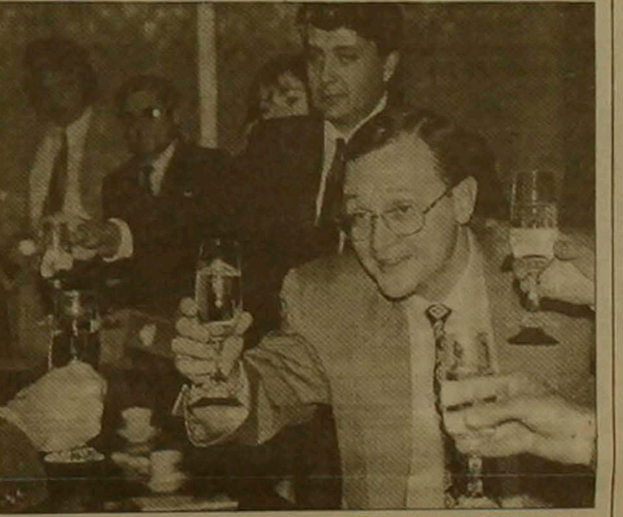
Կիրիենկոն լրագրողների հետ նստում է իր դաճոնաբողոքությունը:

Կան բանկի նախագահ Գորիենկոյի դիմել էին երկրի նախագահ Ելցինին՝ հրաժարականի խնդրանով, սակայն վերջինս մերժել էր ընդունել: Ելցինի այս համառությունը ակնհայտաբար հուսկից հանել էր ոչ միայն Յավլինսկու: Վարչապետի եւ նրա կառավարության գլխին լուսանկեր էին թափում գրեթե բոլորը: Կոմունիստների առաջնորդ Գենադի Չուգանովն առիթը բաց չթողեց լուսանկեր, թե անդեմ է ոչ միայն վարչապետը, այլեւ նախագահը: Վերջինիս եւ այլոց ջանքերով Գումայում հավաքվեց 245 ստորագրություն այն փաստաթղթի տակ, որով Ելցինին կոչ էին անում «կամավոր կերպով հեռանալ»: Դամաբարհային դրակախկայում սա աննախադեղ երեւոյթ էր, նախագահին խորհրդարանական կարգով կամ ինովիմենտի են ենթարկում (անվտանգություն են հայտնում ու դաճոնազրկում), կամ նրա հետ այդդիմադի ծիծաղելի հորդորներով չեն խոսում: