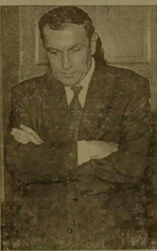
Կառավարող ղեկավարը, ասում են շատ ասուս գարտուր չէ ոչ սեղա ուրիշ բան չեն մսանում կամ ուրում, այսինքն թե լուրը հակասաբուննե չկան:

Այնուամենայնիվ Հայաստանում կա՞ ճգնաժամ, թե՞ ճգնաժամի մասին «լուրեր» չափազանցված կն են միտումնավոր: «Լուրերի» մեկնակցեն առայժմ միայն կոմկուսի