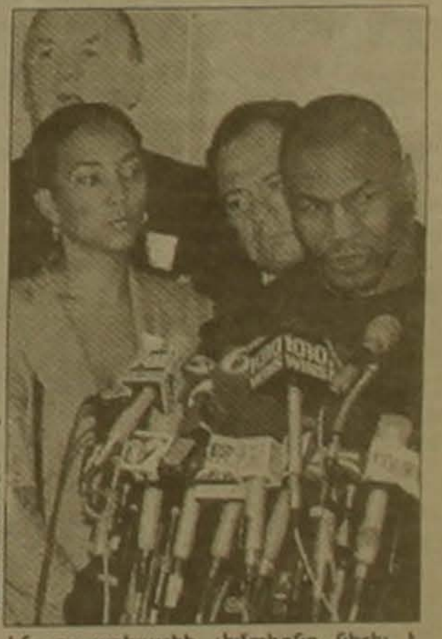
ԵՆ, որ աշխարհի չեմպիոնը մեր է Թայտոնը և դատարան է կրկին մրցել նրա հետ:

Նշանավոր ընդհանրապես, ծանր փուլի կարգում աշխարհի նախկին չեմպիոն Սայի Թայտոնը դիմել է Լյու Ջեյմսի դասարան՝ կրկին դիմել վերադառնալու թույլտվություն ստանալու խնդրանքով: Հիտեցնեմ, որ ավելի քան մեկ տարի առաջ Լաս Վեգասում կայացած մեծամասնությամբ կողմ էր մրցակցի աշխարհի չեմպիոն Էվանջելին Դոմինիկյան կղզիներին: Տիրապետելով մեծամասնությանը հաջողությամբ ժամկետը վերջերս էր լրացել, սակայն ընդհանրապես չէր ԵԱԳ-ում դասարանային արդարացվել: