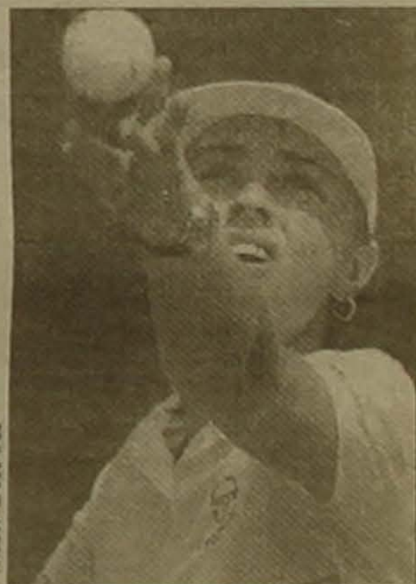
Եվեյցարիայի հավաքականի առաջատար Մարսինա Յինգիսը

Եվեյցարիայի Սյուն Լադաբում մրցեցին Եվեյցարիայի եւ Ֆրանսիայի թեմիստիկները: Աշխարհի թիմ մեկ օակե Սարսինա Յինգիսն ու նրա թիմակից Պեսի Ենայդերը ոչ մի հույս չթողեցին Ամելի Սորեսոյին եւ Ժյուլի Ալարին: Դաշտի տերերը ֆրանսուհիների նկատմամբ վստահ հաղթանակ տարան 5-0 հաշվով եւ եզրափակիչին մասնակցելու իրավունք նվաճեցին: