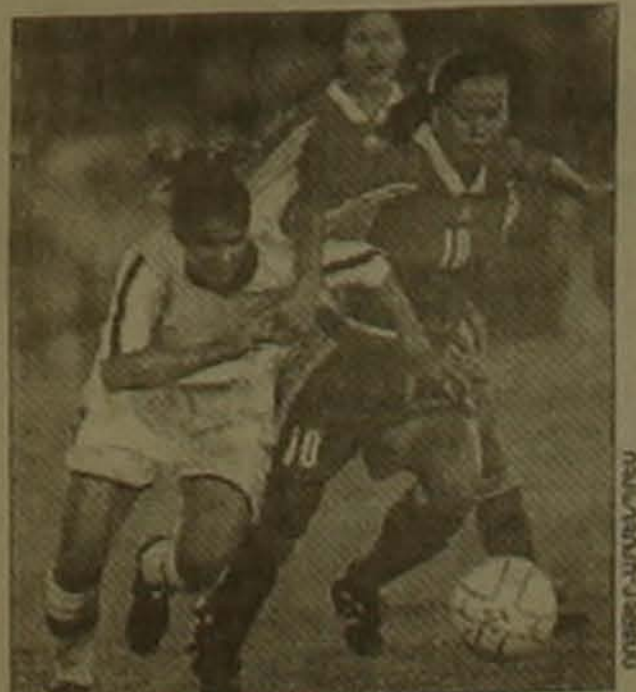
Խաղում են ԱՄՆ-ի եւ Չինաստանի ֆուտբոլիստները

Առաջին անգամ մարմնամարզության մրցումների դասում մեզ անցկացվեցին գույգերի մրցումներ (կին եւ տղամարդ): Ֆավորիտները ռուս մարմնամարզիկներ Սվետլանա Խորկինան եւ Ալեքսեյ Լեմուլը իսպանացի թույլ սվեցին եւ միայն երկրորդ տեղը գրավեցին: Իսկ չեմպիոններ դարձան չինացիներ Ժի Լին եւ Ջյուլի Հոլանդը: Ռուսական մյուս գույգը Աննա Կովալյուկան եւ Ալեքսեյ Բոնդարենկոն: