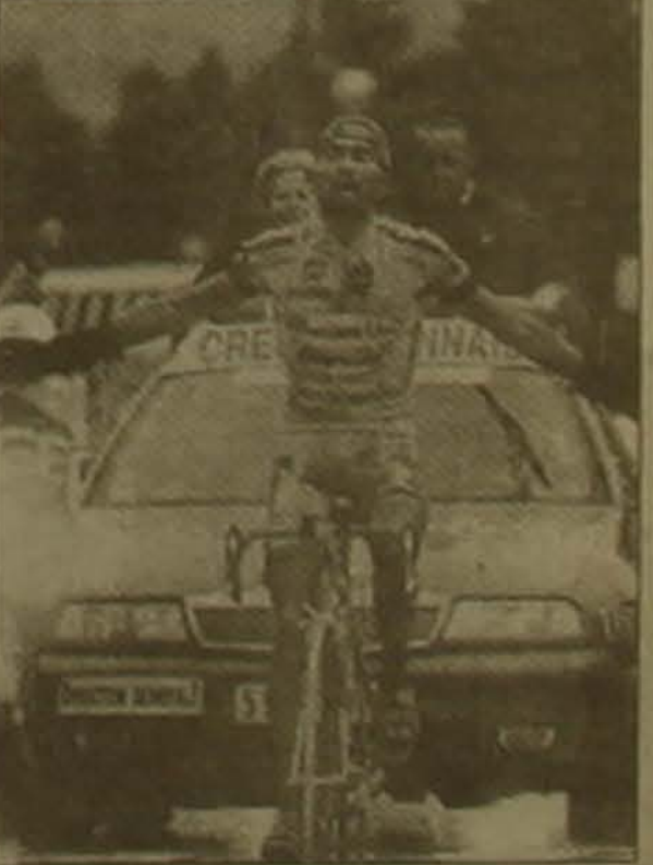
Մարկո Պանսանին որն այս տարի արդեն հաղթել է «Տիրո դ'Իտալիա» հեղինակավոր հեծանվավազում, «Տուր դը Ֆրանսում» էլ առաջին տեղը գրավելու հիանալի հնարավորություններ ունի:

«Տուր դը Ֆրանս» բազմօրյա խճուղային հեծանվավազում անցկացվեց 15-րդ փուլը: Գրեմոնը եւ Լե դո Վլո Լադաբերի միջև ընկած 189 կմ տարածությունը բոլորից արագ հաղթահարեց իսպացի Մարկո Պանսանին («Մերկաժոնե Ունո»)՝ 5 ժամ 43 րոպե 45 վայրկյան: