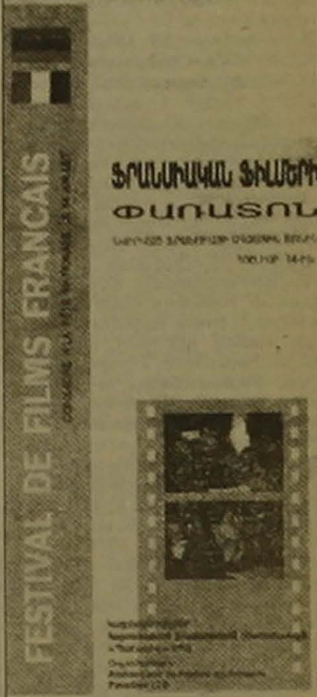
Կցողը, վաղա՛մե՛ղի ժերա Պետրոսյանը: Հուլիսի 13-ին Հայաստանի ֆիլմաւորների միջազգային հանդես եկավ տոնական համերգով՝ նվիրված Ֆրանսիայի ազգային տնօրինությանը:

Ֆրանսիացիները ուրախ ժողովուրդ են, ուրախ եւ ընթրոս: Տարին առավելագույն 3-4 անգամ մարդիկ փողոց են դուրս գալիս՝ դասարաններում իրենց իրավունքները, արտահայտելու իրենց կամքը: Եթե «դարձ ու միամիտ» հայ ժողովուրդը «ախ» ֆաբրիկ կսանի՝ ինչ-որ մի հոգս՝ հազար ու մի բանի հավելք, հանուն հազար ու մի բանի, ֆրանսիացիները ոչ մի դեմքում չեն տուժի, աղմուկ կհանեն, կհասնեն իրենց ուզածին կամ ոչ, եւ ի վերջո այս ամենը կվերածեն եւս մի տոնախմբության: Տոնախմբությունը ավանդույթ կդառնա, կամ էլ ազգային տոն ու կիրճի դարձար: Եվ փանի որ մեկ էլ Ֆրանսիային մոտ (հոգեպես) դրացիներ են, ֆրանսիական տների հեռավոր արձագանքները հասնում են Հայաստան եւ ամառային վառ գույներին հաղորդում ֆրանսիական նոր երանգներ: Ֆրանսիական ֆիլմերի շաբաթը կբացվի հուլիսի 15-ին ժամը 16-ին Մոսկվա կինոթատրոնում: Բացումը կնշանակվի 1998-ին նկարահանված «Կեցցե՛ նորահարսը եւ Բրյուսսելի ազատությունը» ֆիլմը (Ռեժիսոր՝ Զինեթ Սալեմ), որի դերակատարներից մի փանի զանգված են Հայաստանում: Ժերոմ Ռուսվելի «Բախտը» (խոսող եւ մտածող զանգված) եւ Ռոնե Զերեի «Մկրտություն» ֆիլմերին, որ իր ուսանողների երեւոյթներ են ֆրանսիական կինոյում, կհաջորդեն «Անֆայտ սանգոն» եւ «Միտհարված խոհարարի հազար ու մի բաղադրանքները»: Ֆրանսիական կինոնախագահի թարմ մուտքները: Ֆիլմերի վառասուրճը եւ նրանց ընթրությունը նախաձեռնել էր ֆրանսիական դեսպանատան մշակութային