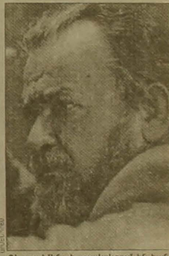
Գեորգ Էմինը եւ ցավակցում են համազգային հարազատներին:

Հայաստանի Հանրապետության նախագահը, Ազգային ժողովը եւ կառավարությունը խոր վճռով հայտնում են, որ կյանքի 80-րդ տարում վախճանվեց հայ ակնաձուլոր բանաստեղծ, ԽՍՀՄ ռեժիսոր մրցանակների դափնեկիր