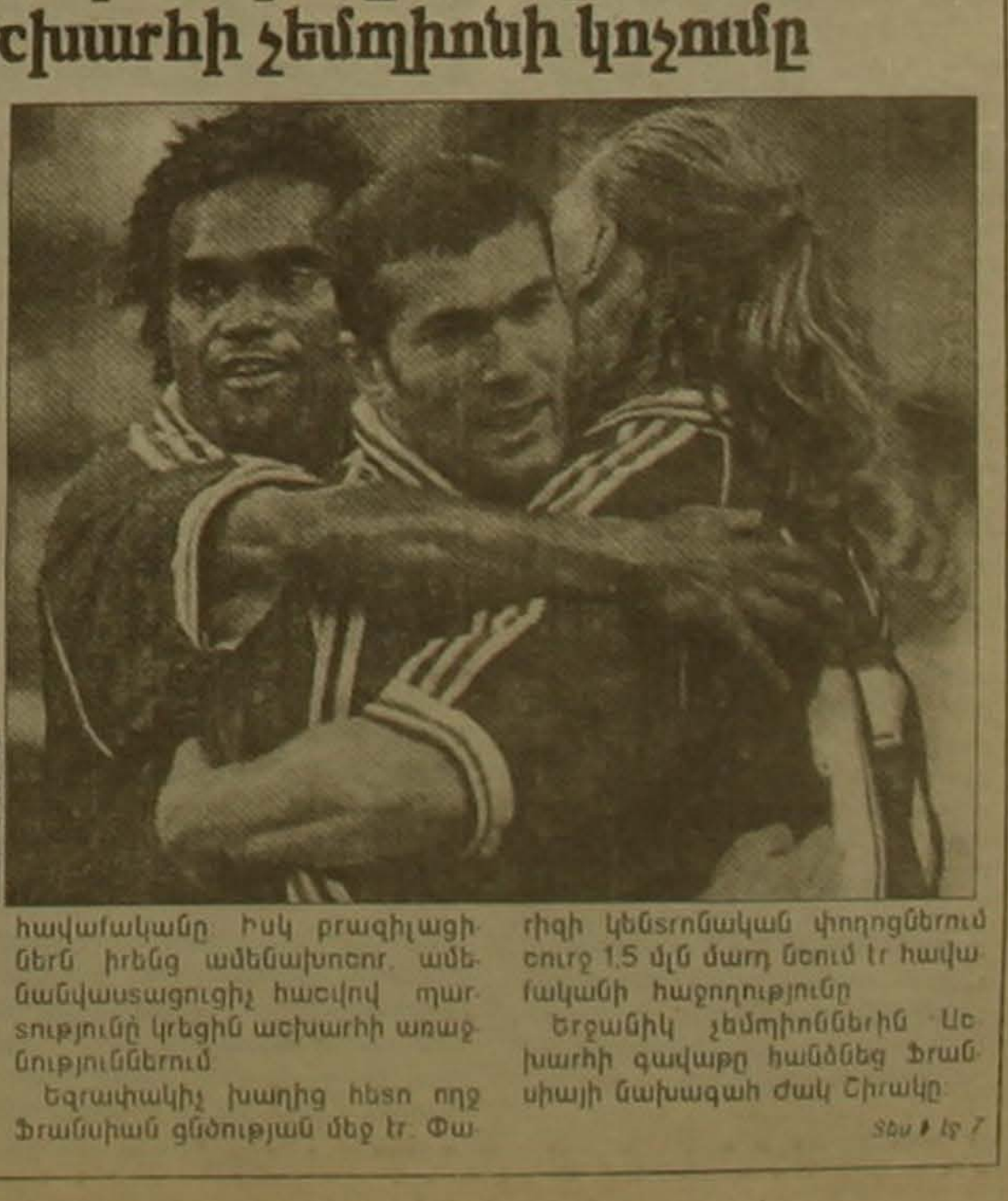
հավաքականը Իսկ քաղաքացիներին իրենց ամենախոնոր ամենակատարագիչի հաշտությամբ Եզրափակիչ չեմպիոններից Աշխարհի զավթող համանոց ֆրանսիայի նախագահ Ժակ Շիրակը

Աշխարհի 16-րդ առաջնությունում ավարտվեց 33-օրյա շախմատային հեռու հայտնի դարձան աշխարհի չեմպիոն եւ մրցանակակիր թիմերը: Եզրափակիչ հանդիպումը մեծ հետաքրքրություն էր առաջացրել: Ոչ միայն ամբողջ ֆրանսիան էր աղյուսում այդ խաղով ոչ միայն Բրազիլիան էր ակնկալում իր սիրելիների 5-րդ քարծուկը, այլեւ ամբողջ աշխարհը ստասում էր ֆուտբոլային ներկայացման վերջին արարին Սոսոլոր սվայներով, եզրափակիչին հետեւեցին հողագործի համարյա 2 մլրդ հեռուստադիտորներ: Փարիզի մոտակա Սեն Դենիի մոտակայքում «Սթար դը Ֆրանս» մարզադաշտի սրբուհունում էին 86 հազար եղջանիկներ, ՖԻՖԱ-ի ղեկավար գործիչներ ժողովակալները եւ Չեղ Բլասսերի գլխավորությամբ կազմակերպիչի համաձայնագրի Միշել Դլաշինին (իսրայել) ֆրանսիայի հավաքականի կազմում անցկացրած արիները նա կրում էր թիմի կապույտ մարզաշաղկի, ինչպես նաեւ ֆրանսիայի նախագահ Ժակ Շիրակը: Տանելով վստահ հաղթանակ առաջին անգամ աշխարհի չեմպիոնի կոչումը նվաճեց ֆրանսիայի