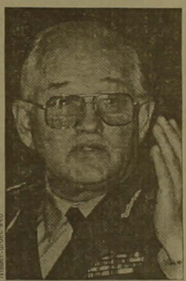
Վան Մասենադարան: Այցի երկօրյա օրը կսկսվի երկկողմ փաստաթղթերի ստորագրմամբ եւ մամուլի ասուլիսով Այնուհետեւ ՌԴ

Երեւոյի առավոտյան երկօրյա դաշնակցական այցով երեւան է ժամանում Ռուսաստանի Դաշնության ռազմաօդային նախարար ՌԴ մարշալ Իգոր Սերգենեն: Այս այցը նախատեսված էր հուլիսի 1-2-ին սակայն հետաձգվել էր մարշալի զբաղվածության եւ ՌԴ ռազմական այցանների գործունեությանը նրա մասնակցության դաշնառով: