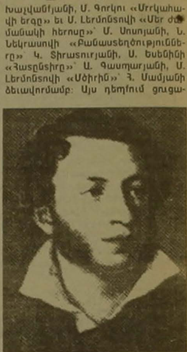
Վեդկեր կուսնային Եղեղ սեփ, մինչդեռ այն սեղ-սեղ համարում է, որովհետև ինչ-որ գրի ստույգապես չի լուսավորվել: Բարեկամ ղեկ կազմից հնարավոր չէ իմանալ, թե ո՞ր գիրք է:

Ռուս գրողների, հասկալիս բանաստեղծների սեղադրությունները սեղ են գտել նաև հայ բանաստեղծների, ասենք Ե. Զարեցի, Գ. Սարգսյանի, Գ. Եմինի, Զ. Սահյանի, Ա. Կառնիկյանի, Վ. Դավթյանի եւ այլոց գրքերում: Ուրեմն դրանք եւս ղեկ է ներկայացվեին, որոշեցի ցուցահանդեսը լինել հարուստ ու բովանդակալից: Միջոցառում կազմակերպվեցր ղեկ է լանսետին նկարի-ձեպարողներին եւ ցուցադրեին Ա. Պուշկինի «Բախչիսարայի Կասկանը» Վ. Սուրենյանցի, «Յեփաթները» Տ.