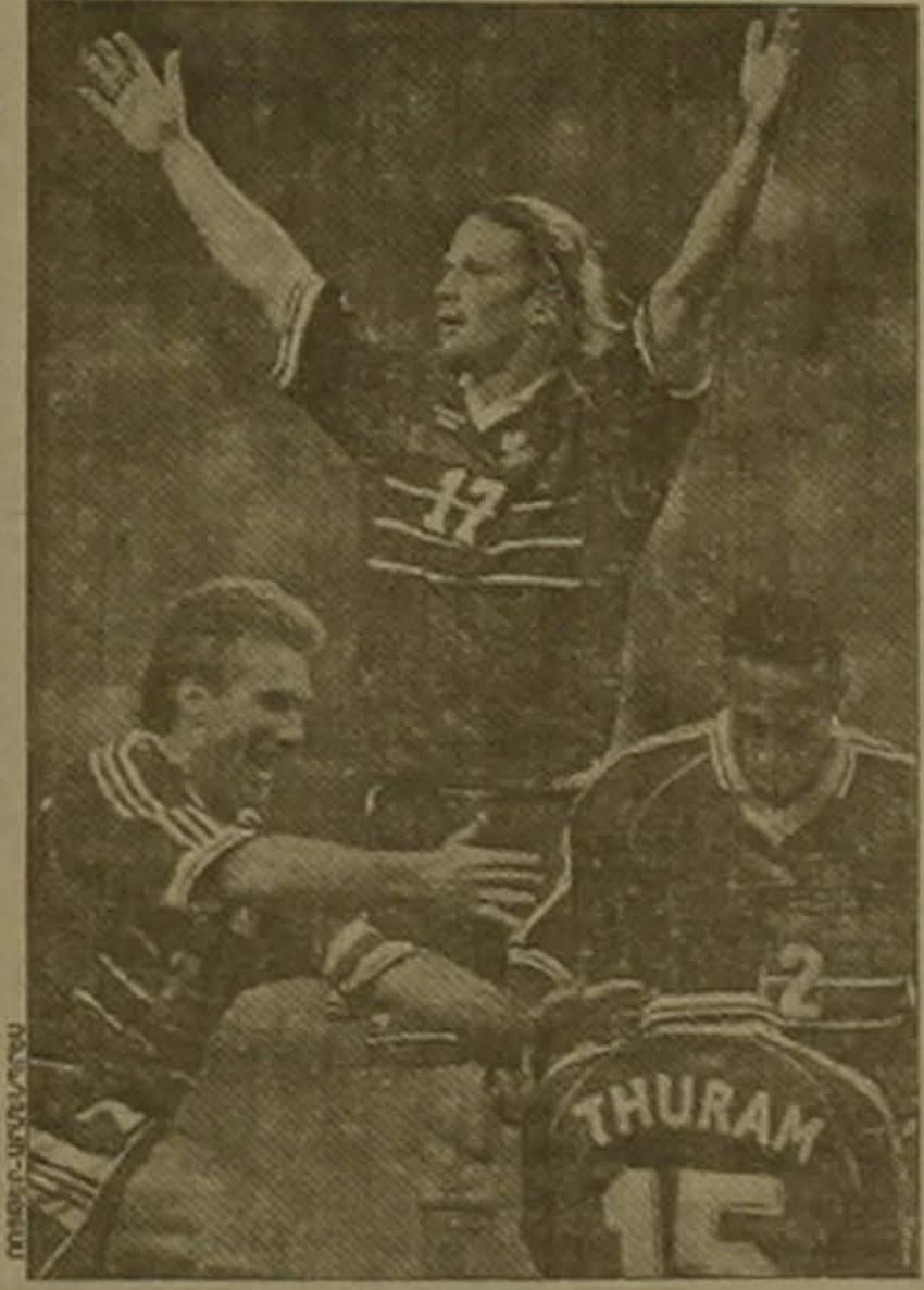
Ֆրանսիացի ֆուտբոլիստները ընկնում են

Դա հաջողվեց անել երկրորդ խաղակեսի առաջին րոպեին: Սամուել Այուսո Ասանովիչի փոխանցումը խորվաթիայի թիմի ամենակարգ ֆուտբոլիստ Դավոր Շուկերը զնդակն ուղարկեց ֆրանսիացիների դարձախոսը: