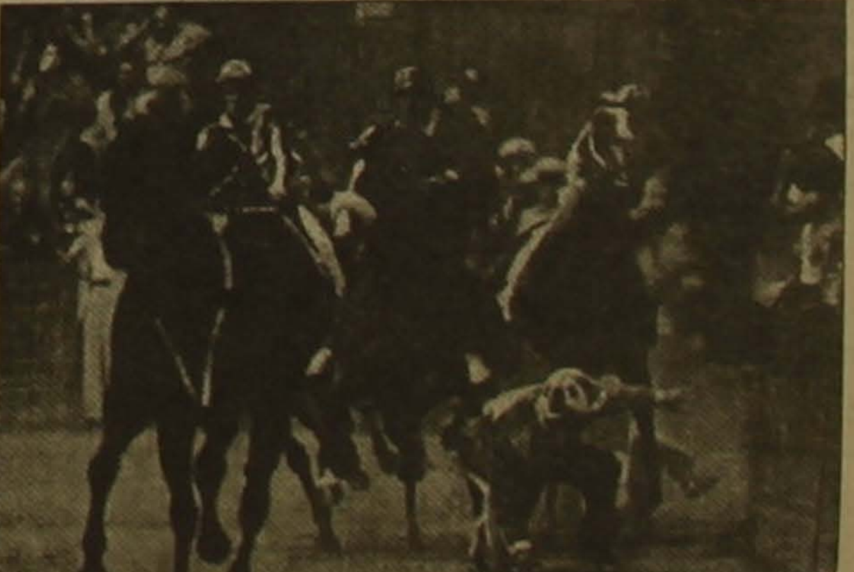
Իտալիայում անցկացված մրցումներում Լուկա Միլիտինոն վայր ընկավ 6 մետրով:

Երեք օր առաջ տեղի ունեցավ Օլիմպիական ավանի հանդիսավոր բացումը: Օլիմպիական օրհներգի հնչյուններին ձայն վեր բարձրացան ՄՕԿ-ի, Ռուսաստանի, Մոսկվայի եւ Համաաշխարհային դասակարգման խաղերի դրոշմները: Բացմանը ներկա էին հաղախաղեց Յուրի Լուկոկոն, որը խաղերի կազմակերպիչն էր, Պաշտոնակարգի օլիմպիական կոմիտեի նախագահ Վիտալի Ամոնովը, որը խաղերի օրհներգը հնչեցրեց, եւ Կոստանտին Կոստանտինովը: