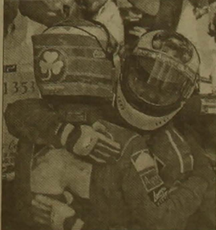
«Ֆերրարի» ներկայացուցիչները Եւրոնակալում են իրար

Անցկացվեց «Յոթուկուս-1» դասի ավտոմեքանիկայի աշխարհի առաջնության 8-րդ փուլը: