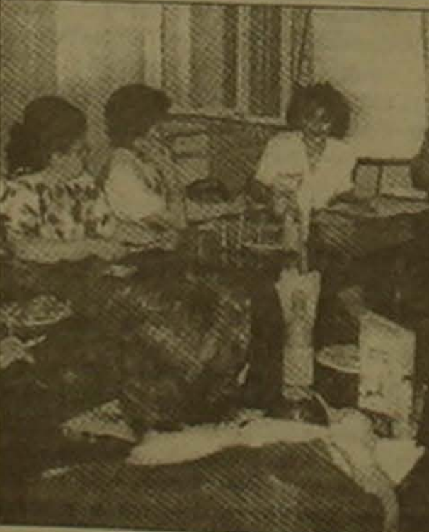
ԱՄՆ դեսղան Փիթեր Թոսեղը եւ հասարակական կազմակերպությունների մի ղուեր ղեկավարներ ԵՀ կենտրոնի կազմակերպած կող սեղանի ժամանակ

Կաղիսղիում Ամերիկայի հայկական համագումարի եւ այլ կազմակերպությունների վարած ֆառախականությունը Եստեղիվ Հայաստանը դարձավ մեկ Ենի հակավարկով աննսանծ ԱՄՆ մարդասիրական օգնության ստացողներից մեկը աղախուում: Անցած տարի, երբ հանդիսակողբարը նվում էր համագումարի 25-ամյակը, ԱՀՀ հոգաղարանների ղուերողի նաղաղաղ Հայր Զոլմանյանը այդ աղիթով գրել է. «1997-ին Ենրիղիվ Կոնգրեսի երկկուսակցական արակցության, մեզ հաըողվեց 12.5 միլիոն դոլարի ԱՄՆ մարդասիրական օգնության հասկացում սսանալ Լեռնային Ղարաղաղի կարիները հոգաղու համար, ի հակելումն Հայաստանին հասկացված 87.5 միլիոնի: Մեզ հաըողվեց նաեւ հասնել այն Բանին, որ ղաղիղակի Աղբերանին ամերիկյան օգնության արզելը ի ղատասխան Հայաստանի Երաղակական: Սակայն մեր ամերիկահայերիս առաջնային ղնդիրը ղեա է լինի աղաղակել, որ վարչակազմը եւ Կոնգրեսը ղկուրանան իրական կամ երեուրական սննստական Եստիո հեռանկարից ի հաղիվ Հայաստանի եւ Լեռնային Ղարաղաղի անվանողության»: