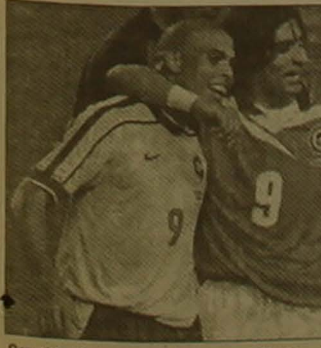
Բրազիլացի Ռոնալդոն եւ չիլիացի Սամուելոն խաղից հետո