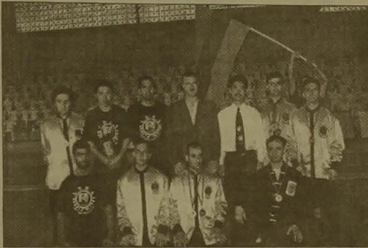
ՄՅՅՈՒՆ-ի անդամները հայկական եռագույնի ներս

Մայր հայրենի կասարած վերջին այցելությունից հետո, ուր ներկա էին զսնվել Մարդարադասի հերոսամարտի 80-ամյակի տոնակատարություններին, Սեծ վարդես Կարո Բեքաբջյանի Հայ սեւ գոտիների միության (ABBA) վարդեսները Եւրոնակեցին իրենց հաղթարժան: Բեյրութի արվարձան Բաաբդա ավանի «Անտոնի» մարզադահլիճում սեղի ունեցած Լիբանանի «Վու-Շու»-ի անդրանիկ առաջնությունում հայ մարզիկ-մարզուհիները յոթ ոսկե, երեք արծաթե ու երկու բրոնզե մեդալներով բարձրացան Պասվանդանի աստիճանին: Արեւելյան մարտարվեստի այս մեծ տոնահանդեսում, ՄՅՅՈՒՆ-ի մասնավոր հրաւերով ներկա էին, որոնք մրցավար ու մարզիչ, Չինաստանի «Շաու-Լի» սաճար-ակադեմիայի վանական ու «Վու-Շու»-ի մասնագետ Կյուն Ջուն ու նրա հզոր աշակերտ Ջո Վեյը: