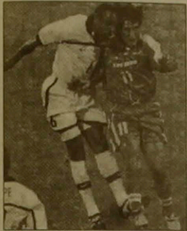
ԻՍԿԱՆԻԱ ՊԱՐԱԳՎԱՅ 0-0: Սենթ Էրյեն «ժոֆուա Գիսար» մարզադաս: Մրցավար Յան Սաֆեռո (ՖԱԳ):