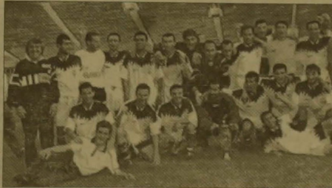
1997 թ. ՀՀ զավարակիր Երևանի «Արարատ»

Ինչպես եւ սղալում էր դիտարկել խաղի շարժումը: Նման հանդիմանում լարվածությունը չափազանց մեծ է, Բանի յուրաքանչյուր սխալ չափազանց բանկ գին էր: Սովորաբար զավարի եզրափակիչ խաղերում ամեն ինչ որոշում է կողմերից մեկի սխալը: միակ սխալը որն էլ դառնում է ճակատագրական: Եվ այդ սխալը թույլ սկսեցին «Փյունիկ»-ը ֆուտբոլիստները: Խաղի 6-րդ րոպեին «Արարատ»-ը խաղադաշտը սրբաբաց գրոհկատվեցին: Ամեն ինչ կատարվեց այնպես որ անսպասելիորեն «Փյունիկ»-ը դաշտաները չիացրեցին հավանաբար ինչ սեղի ունեցավ: Այ եզրում խաղից փոխանցում ստանալով Վիգեն Արսևյանը ձեռքից մրցակցի դաշտանությունը եւ գնդակը փոխանցեց հեռավոր ձողափայտի մոտ «Փյունիկ»-ը դաշտանների հակոտությունից դուրս մնալով Սեդրակ Բաբայանին որն էլ մոտ սարածությունից գլխով գնդակն ուղարկեց անդաժողան դուրս դուրս 1-0: Նման արագ հարձակումներ կարծում են անսպասելի էր նաև կողմերի համար: Այս գոյր որն ըստ սրամարտության շնորհ է վերջին լինել այս խաղում հունից դուրս բերեց առաջին հերթին փյունիկցիներին: Ենթադրում են որ Խորեն Հովհաննիսյանի մտադրանքները, թուր առումներով առավելություն ունեցող «Փյունիկ»-ը ֆուտբոլիստներ ղեկ է ձգեցին արդեն խաղակազմում վճռել խաղի ելքը: Խաղադաշտի հասնելով արագ եւ սուր ձեռնարկների շնորհիվ: «Փյունիկ»-ը գլխավոր