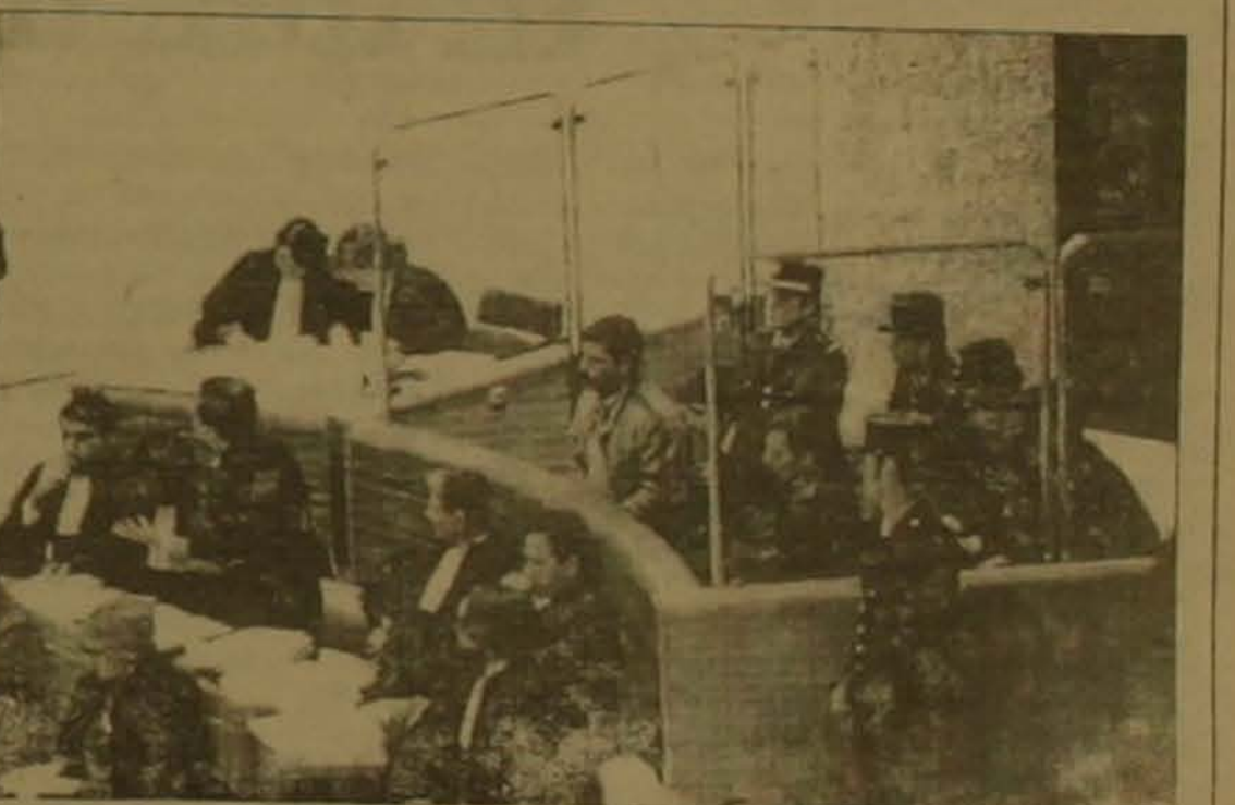
Օռլի դասավարտությունը 1995 թ.

Բուրգինը արտառեց է համարում: Այդ ահաբեկչության հետևանքով զոհվել է 8 վիրավորվել 60 մարդ, սակայն նրա տեսակետից, Ֆրանսիական դատարանը բավարար աղացույցներ չի ունեցել դեմքը Վարուժանին ու նրա ընկերները Միմոնին վերադարձնելու համար: Չարմանալից այն է որ դեմքի վայրում դայրոցիկ նյութերով չի ճանդուղվով ձերբակալվել է մեկ ուրիշը, որը 10 տարվա ազատազրկման է դասադասվել մինչդեռ Վարուժանն ու Միմոնը ձերբակալվել են բոլորովին այլ վայրում: Այդ հանգամանքը փաստաբանին մտածել է ալիս ու Օռլը հաղափական դասավարտություն էր Փաստաբանը մասնավոր դասավարտությունը հաղափական ու րակելու եւս եւս հանդուստում առաջին միջին Օռլի դեմքը Վարուժանն ու Միմոնը իբրև ԱՍԱԼԱ-ի անդամներ, վերահսկվել են Ֆրանսիայի ոստիկանության կողմից, նրանց հետախուսագրությունը մայնագրվել են սակայն Ֆրանսիայի վարչապետը, դեմքից քանակից նվազեցրել էր արժեքը կցել քանակի գործին: Երկրորդ ԱՍԱԼԱ-ն ասանձակ է ահաբեկչության դասախոսանաբարությունը (բուս փաստաբանի, Վարուժանը դա առել է ոստիկանության դեմքի մի խումբ թուրքահայերի Թուրքիա չուրակելու նկատառումով, սակայն երբ դա հանձնվեց մեծվել է նա հեր-