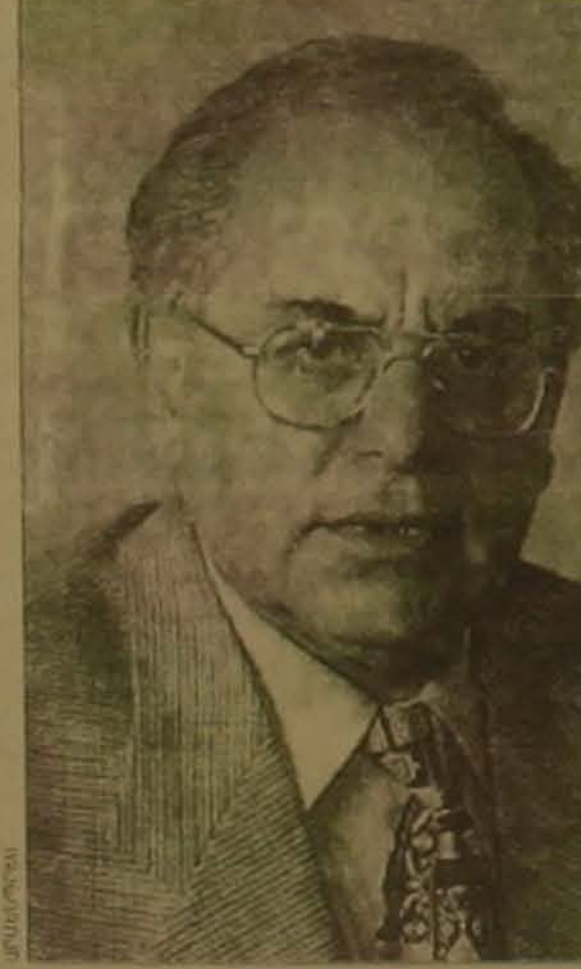
Նրան հաշվարկը կատարել են կամ մասնակցողների թվով կամ ընտրական իրավունք ունեցողների թվով: Իբրեւ մասնագետ կարող եմ ասել, որ մասնակցիցների ընդհանուր թվից հաշվարկ կատարելով ավելի ստույ մոտեցում է Դա ամեն երկրի ներքին գործն է, ներքին խնդիրը, ինչո՞ւ չէ նաեւ ֆաղափարական ոլեսի դասավորվածությունը հանգամանակ է: Ըստ գործունեության կան: Այնպես որ, մեր Սահմանադրության ընդունման լեզվախոսությունը կատարածից դուրս է Այս այդպիսի օրինակներ ուրիշներն ունեն էլ կան, այն էլ բաց: