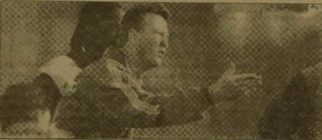
Լուիս վան Գաալը ցուցումներ է տալիս «Այսֆսի» ֆուտբոլիստներին:

Այսօր այդպես հայտնի է, որ Լուիս վան Գաալի նոր ակումբը կլինի «Բարսելոնը» (Բորի Ռոբսոնը մրցաբացի ավարտից հետո կրողնի