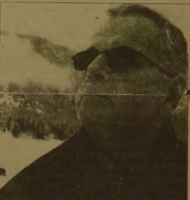
Վազոյն դերասանուհի ճանաչվեց անգլոսի Էբրի Բերթը, իսկ ռյաւարտու լավագույն դերակատար համարվեց Շոն Պենը:

ԵՐԵՎԱՆ, 19 ԱՅՅԻՍ, ՓՈՍՏ. Մայիսի 18-ին հրադարակվեցին Կաննի կինոփառաստանի հորեյանական 97 թվականի արդյունքները: Իգարել Աբրահիմի գլխավորած Կուրիկ կանգնած էր դժվարին ընտրության առջեւ. թերեւ հենց այդ պահանջով փառաստանի գլխավոր մրցանակը Ռուկե արմավենյան Եւրոպայից ոչ թե մեկ այլ երկու կինոռեժիսորների: Փառաստանի գլխավոր հաղթողները դարձան ճապոնական կինոյի վարդես ռեժիսոր Մահեյ Իմամուրոն եւ դարսիկ կինոռեժիսոր Արաս Կիրիստամիր իր «Բալի համը» ֆիլմի համար: Փառաստանում փայլուն հաջողություն ունեցավ կանադացի Ասում էգոյանի «Լուսավոր աղազ» ֆիլմը, որը Եւրոպայի փառաստանի գրան-պրիին: Փառաստանյան ծրագրի լա-