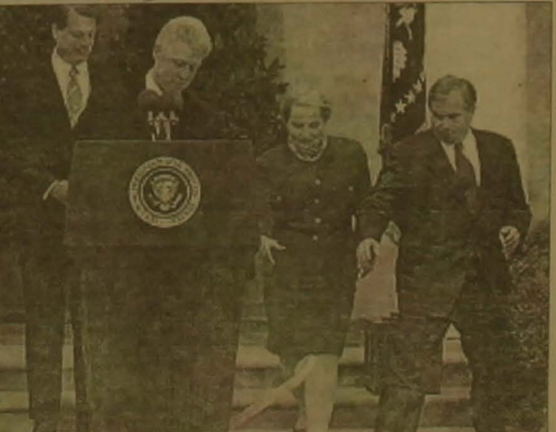
Փոխնախագահ Այ Գորը (ձախից), դեճտնաբան Մաղղեն Օլբրայթը եւ Ազգային անվասնգության խորհրդական Սանդի Քերգերը (աղից) մի ֆանի վարկան հեճաճալը նախագահ Բիլքլոնին բարձրացնելու վարչ ընկած ձեղակայացը, մայիս 14: Մղիսակ սան վարղերի դասեղ Այնուհեճե Բիլքլոնը խոսել է ԱՄՆ-ի եւ Ռուսաստանի նոր համադրանաղղի մասին դա անվանելով դասական խղղ խղղաղղ, յնասնասկած դեճնաբանական եղղողա սեղղղելու ճանաղղարհին: