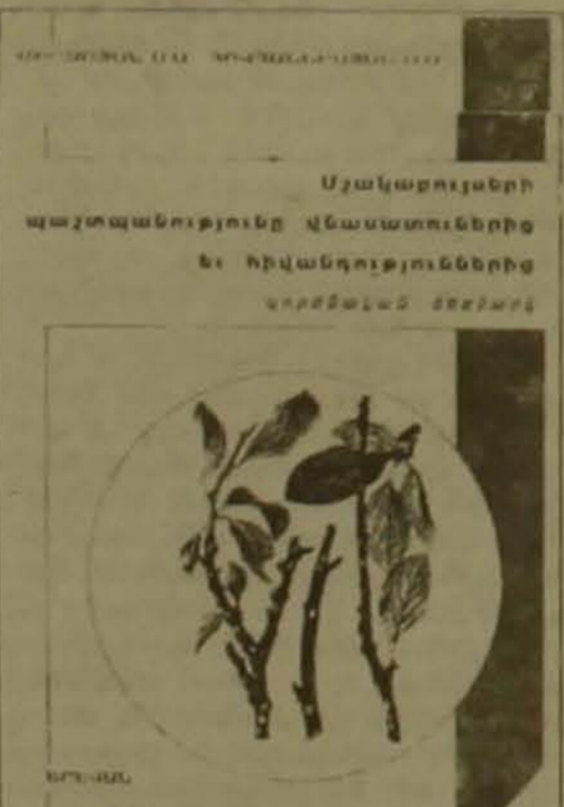
գործվող բուսանյութերը, ա) մեծ

2-րդ զլխում բերված են բույսերի դասակարգության համար օգտա-