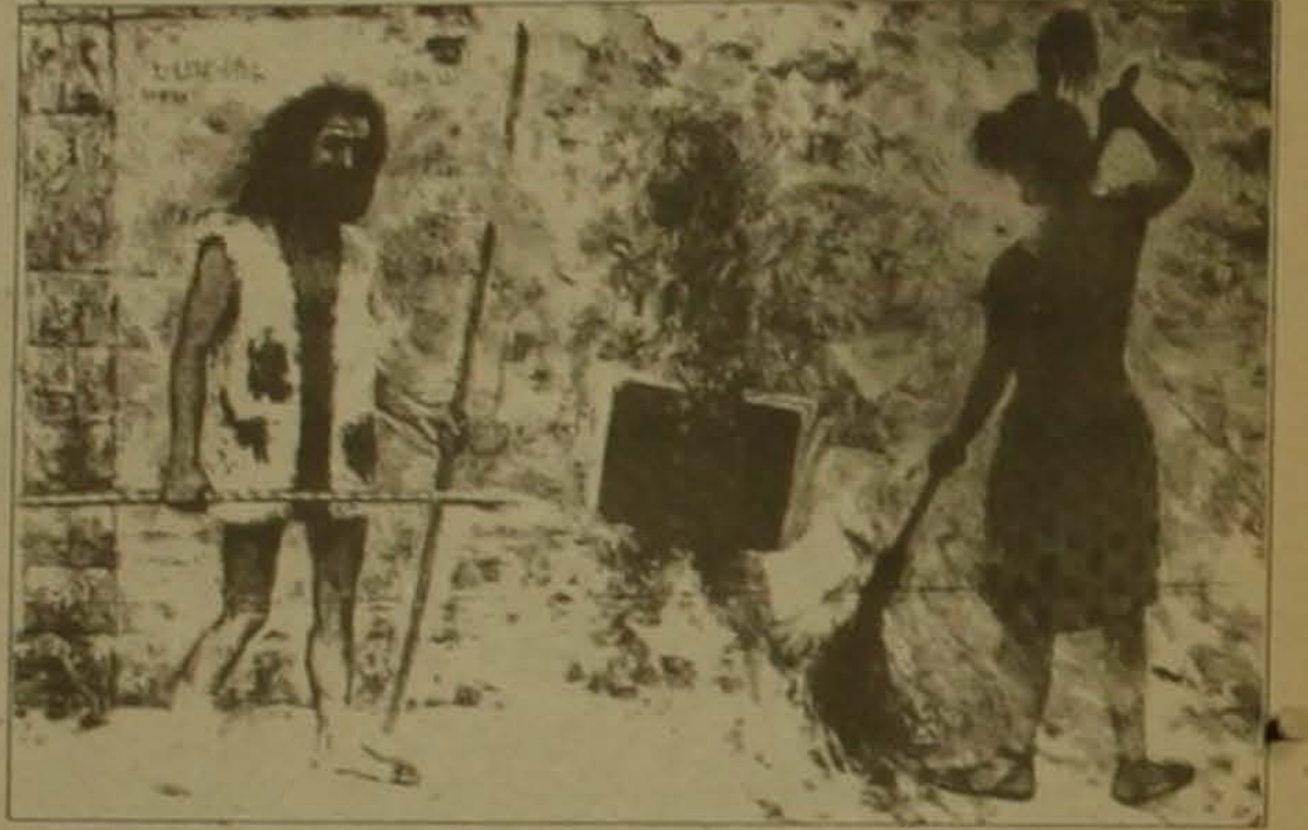
Սամվել Մարտիրոսյան «Նովահանես Սկրիպ»

Պատկերով ստեղծագործող հակառակ ընդունված ժամանակակից արվեստի վաղ փուլերն են, եւ հաճախ գործի հենց այդ որոշադրանքներն են արվեստագետի ճանաչարձանը: