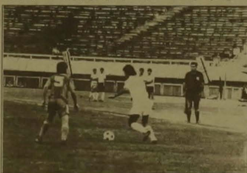
Ֆուտբոլի խաղարկության կիսաևզրափակիչի մասնակիցները