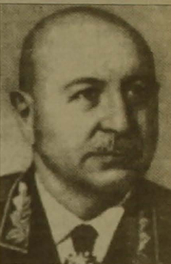
Մարշալ Բաղրամյանի մասին բազմաթիվ հրատարակումներ են նախատեսվում ակադեմիական հանդեսներում եւ յարբերական մամուլում:

ԵՐԵՎԱՆ, 3 ԱՊՐԻԼ, ԱՐՄԵՆԴՐԵՆ: Այս տարի լրանում է հորհրդային Միության կրկնակի հերոս, մարշալ Գեորգի Բաղրամյանի ծննդյան 100-ամյակը: 33 գիտությունների ազգային ակադեմիան հորեւյանը նշելու ընդգրկում ծրագիր է մշակել: