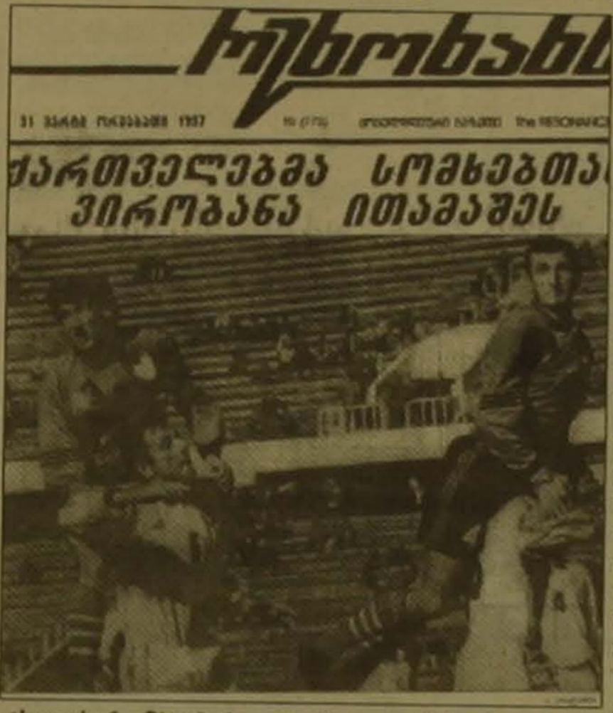
Վրացական «Ռեզոնանս» թերթը իր առաջին էջում զետեղած ճյուղի վերնագիրը համադասախանդեցնելով Վրաստան-Հայաստան խաղի նկարի հետ, անվանել է «Վրացիները հավաքական խաղից հայտնի գլխին»:

1962 թն 1963 թթ. Թբիլիսիում տեղի «Դինամոն» 5-0 հաշվով ջախջախիչ դարձրած մասնակց «Արարատին»: 5 գնդակի հեղինակն էլ մեկ ֆուտբոլիստ դարձավ Դարձնաձորի (այդ ժամի նա դարձավ ԽՍՀՄ-ի Միության ֆուտբոլի առաջնության ունիվերսալ): Խաղից հետո ցնծացող վրացիների ծափոտյունների ձայն դինամոյականները եւ նրանց միացած երեք արարատցի մեկնեցին կեռուխումի, նեղու այդ ֆուտբոլային բաժնեխաղը: Այն ժամանակ մեզանում ոչինչ չիսկացան, կամ ցույց չսկսեցին: Աստուծոյ կեղծ հանգիստ մաքրեցին դեմքերից, ընդունելով կասարվածը որդես գոտ մարզական անհաջողություն: