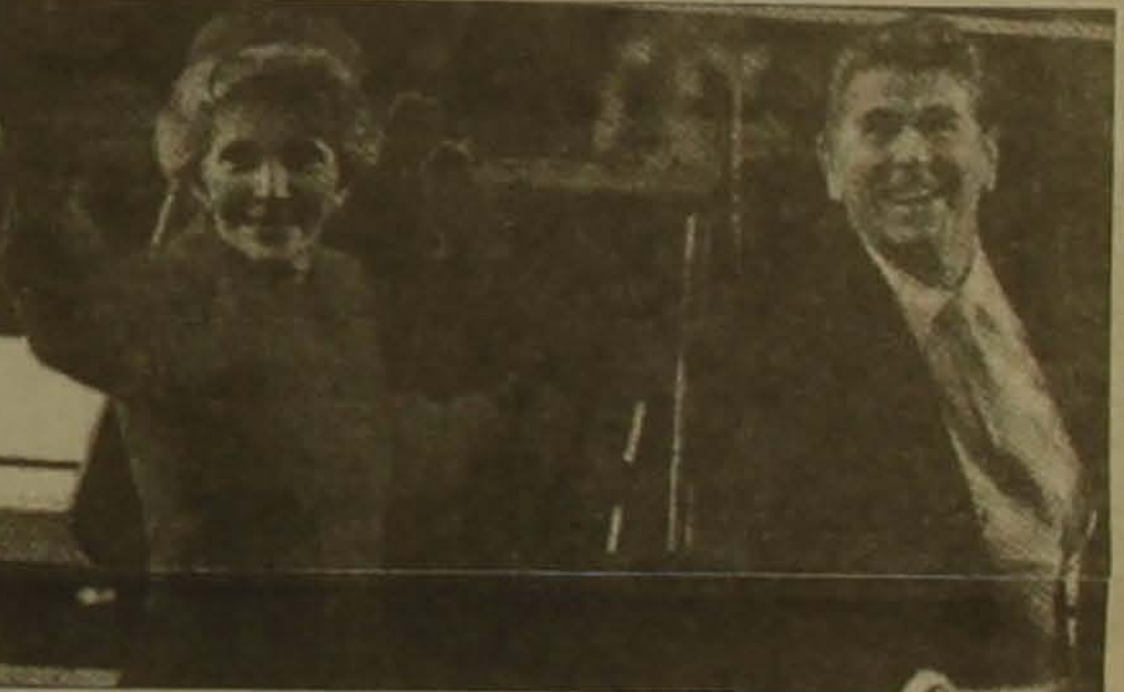
Ռոնալդ Ռեյգանը և ԱՄՆ-ի նախկին «առաջին» տիկին Նեյսի Ռեյգանը Լոս Անջելեսի իրենց Բել էր անունով տանը նեցցին համատեղ ամուսնական կյանքի

Ինչպես գրում է «Ինտերնեյշնլ հերալդ 45-ամյակը: «Անցած 45 տարիներ ակնհայտորեն», ԱՄՆ-ի նախկին նախագահ րարի նման բուն: Ես չեմ դասկերաց-