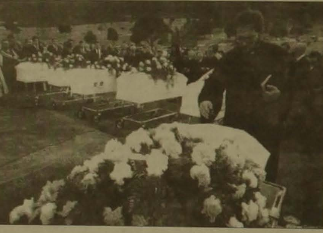
Ավանեսյանի ընտանիքի բաղունը

րում: Ընկնելով մի նոր հասարակություն, որտեղ կարելի է վճարել Կալիֆոռնիայի ընտանիքի ընթացում Գաղթյանը օգնություն էր ստանում մեկ եկեղեցուց: Մի անգամ նա կորեց եկեղեցու երկարա դարձալը Մեկ այլ անգամ, գիշերով եկեղեցի մտնելով, բացել էր գաղի ծորակը, փորձելով Իրիզի խոհանոցը: