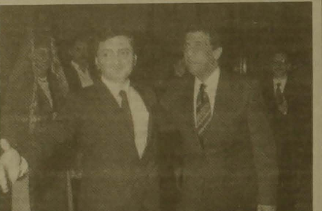
Էդուարդ Նալբանդյան եւ Ամր Մուսա

Նույն թվականի մայիսին Եգիպտոս այցելեց ՀՀ նախագահ Էտոն Տեր-Պետոսյանը: Այցի ընթացում Հայաստանի եւ Եգիպտոսի միջեւ ստորագրվեց սենսական եւ գիտատեխնիկական համագործակցության մասին դայանազիր որի հիման վրա էլ սեղծվեց միջկառավարական համեմատողով: Համեմատողովի առաջին նիստը տեղի եւունեցել 1996 թ. հունիսին Երեանում երկրորդ նիստը տղաավում է այս տարի մայիսի երկրորդ կեսին Եգիպտոսում: