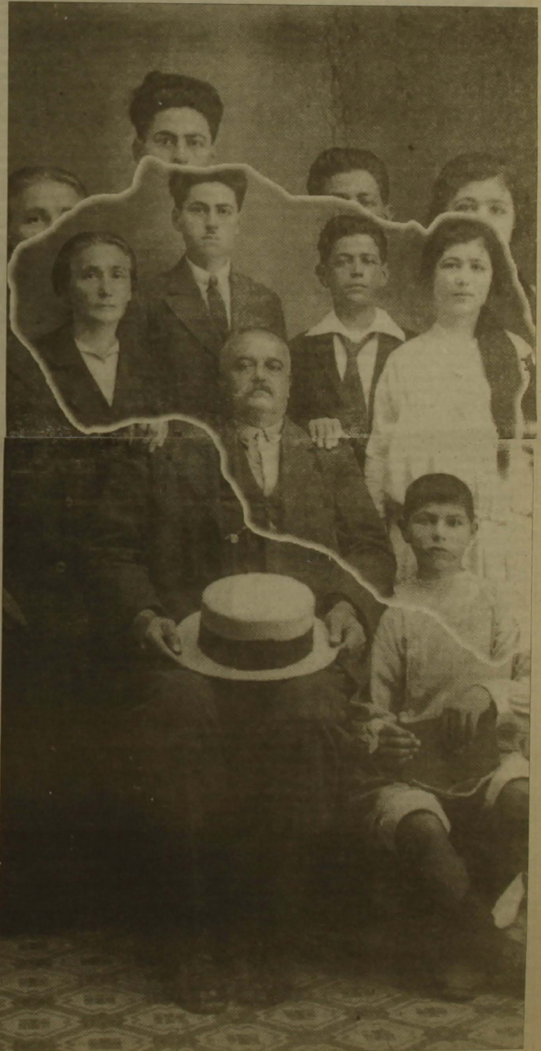
Պարսիզակցի հայ ընտանիք