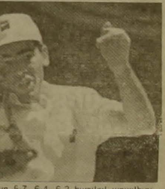
Սր 5-7, 6-4, 6-2 հաճվով առավելության հասավ ավստրալացի Պարիկ Ռաֆերի նկատմամբ:

Անցած հանգստյան օրերը կրկին քեմիսի տղեր վերաճեցին: Ֆիլադելֆիայում եւ Միլանում վերջնազիծը հաճեցին Տղամարդկանց երկու մրցաքրեր: Իսպանիայի հյուսիսում կայացած մրցաքրի եգրափակվում հոլաք Գորաս ուլանուրը մրեւույն 6-2 հաճվով երկու խաղափուլերն էլ աւեց հաղանացի Արիսի Բրազեյա: