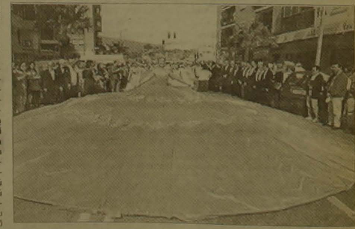
Միջերկրականի Տրեմոլիտոս անոդարանի փողոցներում 60-ամյա Մարիա Լալյուն ցուցադրում է աշխարհի ամենամեծ կարգապահը: Դրա տրամագիծը 8.5 մ է, երկարությունը 100 մ է, հավանում է մեկուկուսուկուսական Գիսկի գիւղ: Ողջունը մրցել էր Երևանում

Անցյալ դարի 70-ական թվականներին, հայ ժողովրդի ազգային ինքնագիտակցության վերելի տարիներին, անհրաժեշտություն էր դարձել նոր սերնդին ժամանակի լուսավոր գաղափարներով ժողովրդասիրության, հայրենասիրության մարդասիրության զգացումներով դաստիարակելը: Եվ ահա մեծ երգիծաբան Հակոբ Պարոնյանը ձեռնամուխ է լինում մանկական ամսագիր սեղծելու գործին եւ 1876 թ. Կ. Պոլսում սկսում է հրատարակել «Թասրոն բարեկամ