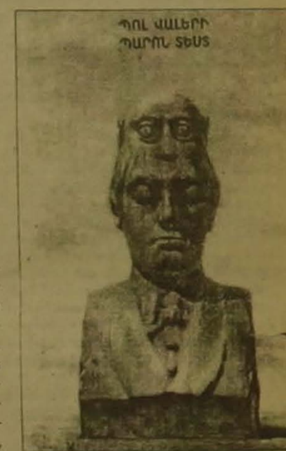
Պոլ Վալերիի «Պարոն Տես»

Ա եւ Մ (ԱՆՆԱ եւ Միխայել) հրատարակչությունը լույս ընծայեց Պոլ Վալերիի «Պարոն Տես» 180 էջանց գիրքը: Այն լույս է տեսել Վահան Տերյանի անվան «Օգնություն հրատարակչական գործին» ծրագրի երջանակներում, Ֆրանսիայի արգործնախարարության եւ Հայաստանում Ֆրանսիայի դեսպանասան մեակութային բաժնի արակցությունը: Գիրքը խմբագրել է Թադեոս Խայարյանը, նկարիչը Մեդեյ Երազյանն է: Տղագրվել է Ոսկան երեւանցի տղարանում: «Ազգի» ընթերցողին հայտնի է, որ Ա եւ Մ հրատարակչասունն առաջին անգամ հայերեն է ներկայացնում XX դարի ֆրանսիական գրականությունը: Մրե՛ն հրատարակվել են Անդրե ժիդ՝ «Նեղ դուռը», Մարգրիտ Դյուրաս՝ «Հանգիստ կյանք», «Հիրսիմա, իմ սեր», «Սիրեկան», Պոլ Էլյուար՝ «Բանաստեղծություններ», ժան Անույ Թատրոններ, Մեն ժոն Պերս՝ «Գովեսներ», «Անաբասիս» հասորները: «Պարոն Տեսից» հետո Ա եւ Մ-ն լույս կընծա-