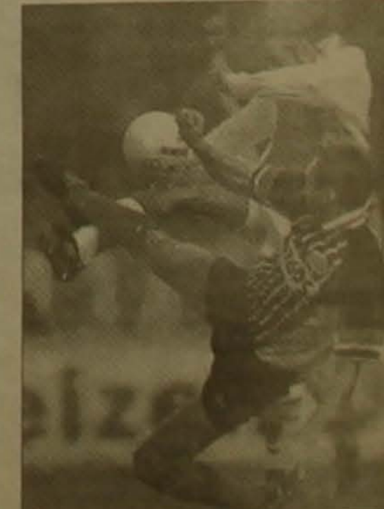
Մի դրվագ «Այաքս»-«Էյնդհովեն» հանդիպումից:

Եվ աղա 20-րդ տուրում, սեփական հարկի սակ ընդունելով «Էյնդհովենին», «Այաքսը» նույնիսկ գող ընդունեց իր դարդասը, որքես նախորդ 19 հանդիպումներում: «Այաքսը» դասարան կրեց 3-4 հաւելով Լա ճարունակում է 55 միավորով գլխավորել առաջնության արուսակը: «Էյնդհովենը» հեծ է մնում 15 միավորով (սակայն այս թիմը մեկ խաղ դասարան է անցկացրել):