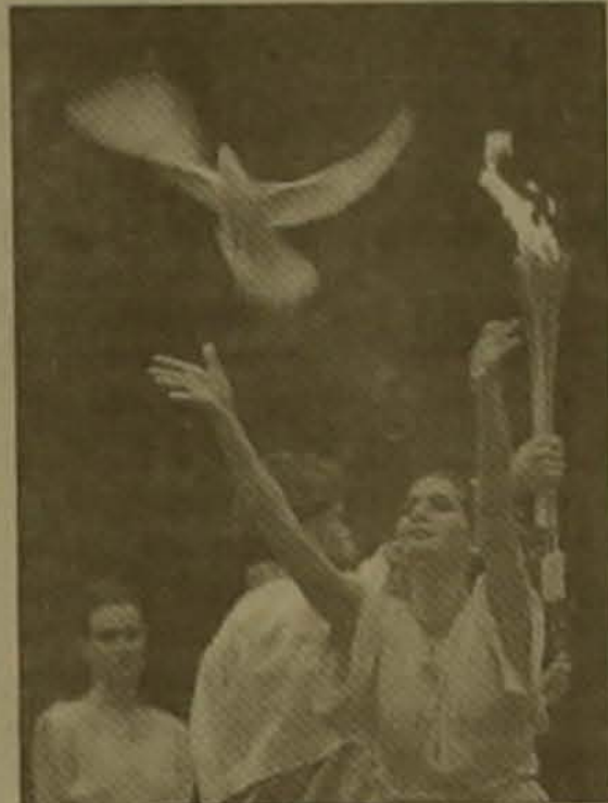
Հին Օլիմպիայի ավերակների մոտ վառվեց օլիմպիական կրակը: Այն ճանադարի թանգը դեղի ճաղոնիա: Ավանդույթի համաձայն, ի նեան խաղադուրյան, այս սղիակազգեստ արղիկն արղավի է քաց թողնում:

Այժմ գեղասահորդները դասարանվում են հուուկար ամսին Իսախայում կայանալի Եվրոպայի առաջնությանը: Իսկ այնուհետեւ նրանց սղատում է մրցաշարի ամենախոուր իրադարձությունը Լազանոյի ձմեռային օլիմպիականները: