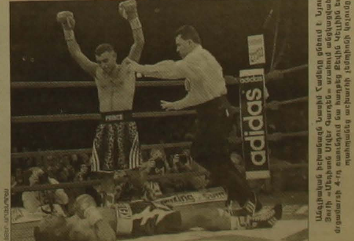
Անգլիական հեռուստաը Նագանոյի Վազորդներում է: Նյու Յորկի «Նյու Յորկ Գառնեթ» օրաթում անցկացված մրցաբարի 4-րդ րոտում Նագանոյից հաղթեց Էվեդիային և Ռուսաստանը աշխարհի չեմպիոնի կոչումը

Մրցաբարի հաղթողի կոչման համար մրցեցին Չեխիայի և Ռուսաստանի, երրորդ տեղի համար՝ Զինվանդիայի և Էվեդիայի հավաքականները: Վճռական խաղում եւս չեխերը առավելության հասան (1-0) և նվաճեցին գլխավոր մրցանակն ու 70 հազար դոլար: Երկրորդ մրցանակալի Ռուսաստանի թիմը դարձեաւրվեց 40 հազար դոլարով: Հաղթելով մրցակիցներին 2-1 հաշվով՝ երրորդ մրցանակը եւ 25 հազար դոլար տոն սարան Էվեդիայի հոկեյիստները: