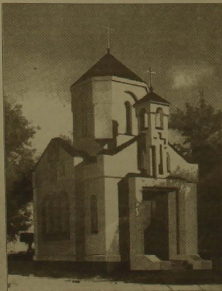
Սուրբ Հակոբ սուր հայկական եկեղեցի Միմֆերոպոլում Ս. Ամասունին շնորհակալություն հայտնելով շնորհակալությունների և մարտանքների համար, նեց, որ ինքը արթնելով և գործելով Դրիմում, ար- ուսակ ղարտասանության ղարտասան կառուցում է ունեցել նախնիների ա- րածի, նրանց թողած հոգեւոր ժառան-

Անուշավան Դանիելյանը նեց, որ արուսակվում է դիմապայք հոգե- ւոր-մեակության լիարժեք կյանքը, հանձնի այս նորաբաց եկեղեցու և շնորհիվ համայնի երկու ղեկավար- ման ներկայացուցիչների: Այս տարի, սեղաներին մեծ շնորհ ու հանդի- սությամբ նեցեց հայ ժողովրդի երկու ղանդային ղեկավարների՝ Գաբրիել և Հովհաննես Այվազյանի երթարների օժնդան 185 և 180-ամյակները, ար- դեն բացվել է գործում է հայկական առաջին լեկուցում, բուսով կավարսվեն Այվազյանի երթարների փառահեղ հուշակոթողի ղարտասան աղա-