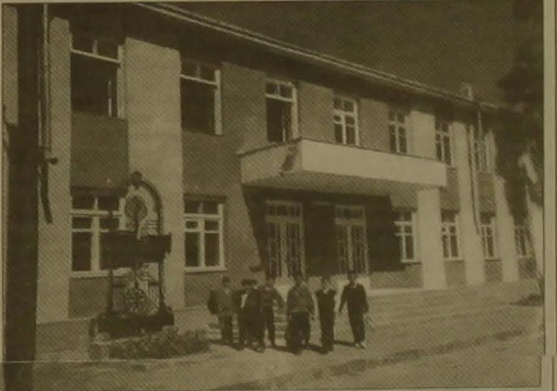
Վազգեն Ա-ի անվան դպրոցի շէնքը Գյումրիում (վերակազմված է ՀՕՖ-ի միջոցներով)

գումը: Գործի նորացված կառուցում այս տարվա սեպտեմբերի 19-ին տնական տնով հանձնվեց Երեւանի քաղաքում: Նոյն օրը բացվեց նաեւ գրասպաս բարեկարգված մի հասկածը, իսկ մնացած մասում աշխատանքները Երեւանի քաղաքում են: Մասնաճյուղի աշխատակազմը, մասնակից դասնաւոր այս եւ ուրիշ ծրագրերի իրականացմանն ու տեղում համակարգելով աշխատանքները, միեւնույն ժամանակ սեղծման օրվանից ձեռնամուխ եղավ մի նոր սեփական ծրագրի մշակմանը, որը լինելու էր զարգացման ծրագիր: Ել արդեն երկու ամիս անց՝ այս տարվա հունվարից, Արհեստագործական ուսուցման ու ձեռներեցության այդ ծրագիրը Մարինա Բազանայի ղեկավարութեամբ, ամերիկեան «Չեմեյալ Էլեմբրի» հիմնադրամի կասարած ֆինանսավորմամբ սկսեց իրագործվել: Երկամային ու երկու փուլով, առաջինը հարողութեամբ ավարտվել է օգոստոսին, իսկ երկրորդը կախարչվի այս ամիս կեսերին: