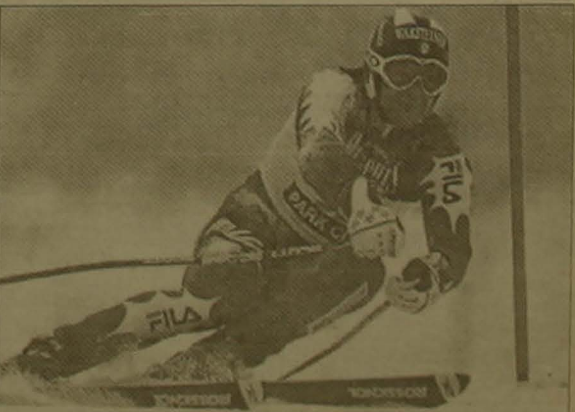
Լեոնադաիուրոցները սկսել են դայաբար Աշխարհի զավաքի համար սկաում հանաիայ Ալբերտո Տոլաոն (Իտալիա) որը ԱՄՆ-ի Ֆուտս ճանադի Պարկ Միթում անցկացված փուլում միայն 12-րդ արգույնը ցույց սկեց

Ինչդաբ հայտնի է, աշխարհի առաջնության եզրափակիչի վերջին 32-րդ ուղեգիրը կվիճարկեն Իրանի եւ Ավստրալիայի հավաքականները: Առաջին խաղը դեմ է կայանա այսօր, Թեհրանում, երկրորդ մեկ շաբաթ հետո, Ավստրալիայում: