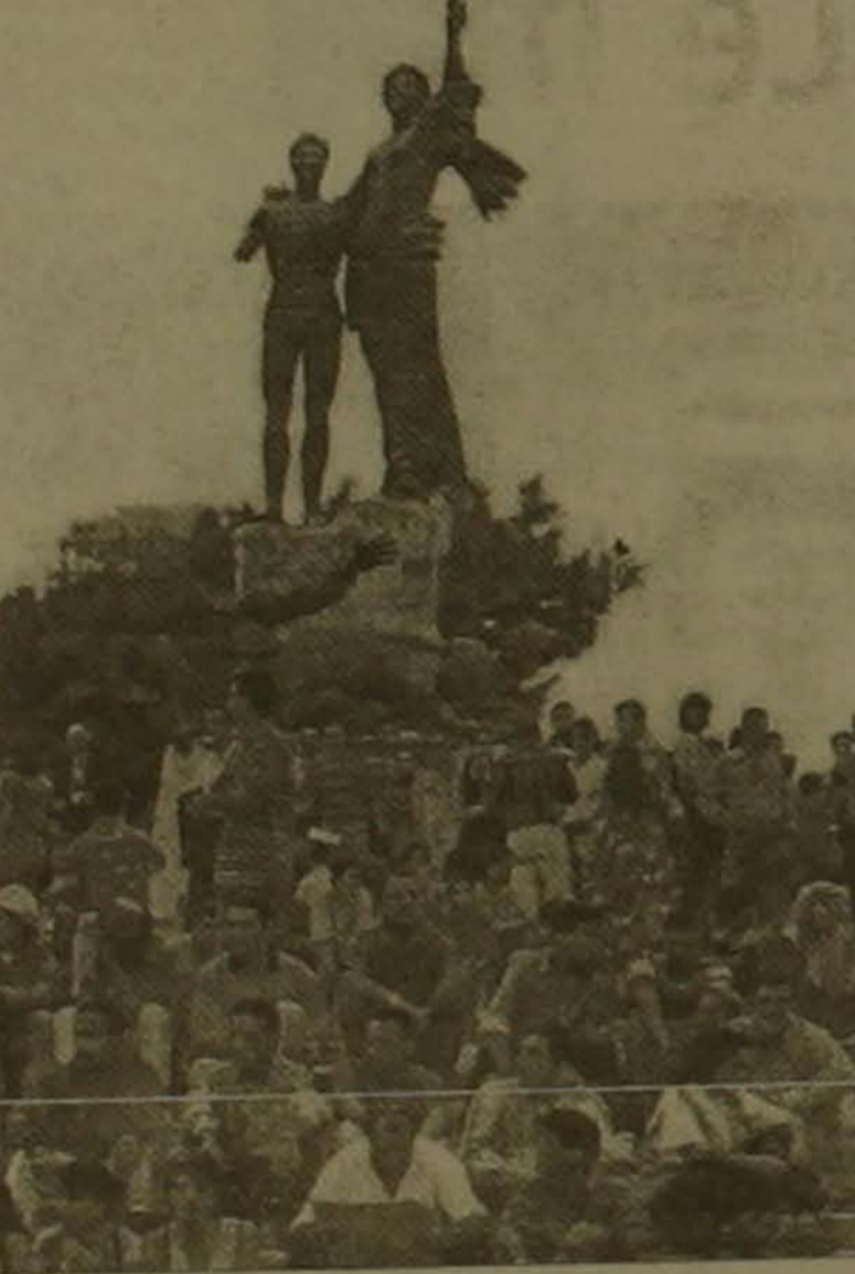
Բեյրութի կենտրոնական Բուրջի հրադարակի Նահասակաղ հուշարձանը Այս հրադարակում 1915 թ-ին բուրջը կախողան բարձրացին 2 տասնակից ավել լիբանանցի մշակութականներ

բանակի հեռացումը երկրի հյուսիսից եւ արեւելից: Հայտնի է, որ Լիբանանը արդյունաբերության մեջ թույլ զարգացած երկիր է, բայց ունի համեմատաբար բարձր կազմակերպված ֆինանսաբանկային համակարգ, սրասարկման ոլորտ եւ տուրիզմ: Ի դեմ, նախադաստրազմայան ժամանակաշրջանում դեռևս կան բյուրեղի մուսֆի 20 տոկոսը կազմում էր տուրիզմից ստացված եկամուտը: Ունի կրթական լավ ցանց, որտեղ ամերիկյան եւ ֆրանսիական համալսարանները խաղում են կարևոր դեր ոչ միայն Լիբանանի, այլև ամբողջ սարածագրանի համար: Անուշտ, երկրի ստեսության սոջ կարևոր դեր է խաղում օտարերկրյա կադիսալը հասկաղես արաբական եւ արեւմտեւերոդականը: