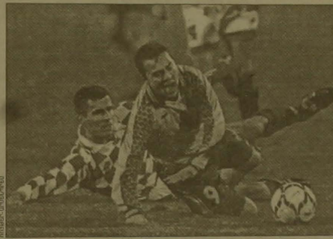
Սի դրվագ աշխարհի առաջնության եզրափակիչի համար Ուկրաինա-խորվաթիա խաղից, որն ավարտվեց 1-1 հաշվով:

Հայտնի են դարձել 1998 թվականի ամռանը Ֆրանսիայում անցկացվելիք ֆուտբոլի աշխարհի առաջնության եզրափակիչի 32 մասնակիցներից 31-ը: Ասիական զոնու երրորդ ուղեգիրը վիճարկեցին երկու խմբերում երկրորդ տեղերը զբաղեցրած ճապոնացի և Իրանի հավաքականները: Մալայզիայում կայացած խաղում ավելի ուժեղ էին ճապոնացի ֆուտբոլիստները, որոնք հաղթեցին 3-2 հաշվով և իրավունք ստացան հանդես գալու Ֆրանսիայում: