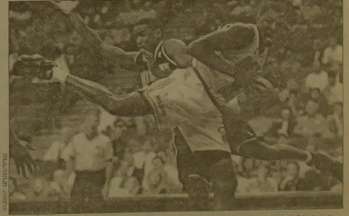
Հարուստ կազմով են բաղկացրել ազգային միության (ՄԱՅՏ) խաղերը Լուսանկարում գեղատիպ համար դայաբարում են Քեթա Անգլիան («Մայամի Իթ») և Թեյնի Դեմեր («Մարտնեթո ինգ»)՝ խաղը 102-82 հաշվով շահեցին Մայամի բաղկացրածները:

Մուգ գույնով առանձնացված են 1/4 եզրափակիչ դուրս եկած քիմերը: Փակագծում սրված են առաջին խաղերի արդյունքները: