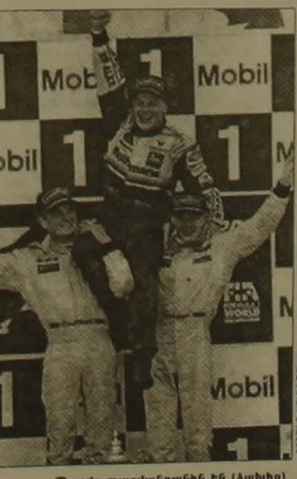
ղաշտակ ղաշտակողներն են (ձախից) Դեիդ Կուլտարը, աճխարհի նորընծա չեմպիոն ղակ Վիլյոյվը եւ Միկա Հակկինենը

Չեմպիոնի կոչման համար ղայիարը չափազանց սրվեց 16-րդ փուլից հետո: Սուղուկայում անցկացված «ճաղոնիայի մեծ մրցանակում» Վիլյոյվը ընղամենը հիմնաբերող տեղը ղավեց (կանղացու բախսը ճաղոնիայում չի բերում, անցյալ սարի այստեղ անցկացված մրցումներում ղոկվեց նրա մեներմայի ետին անիվը): Իսկ Ծումախերը, կարելու հաղթանակ տանելով կարուկայում, կանղացուց ես էր մնում մեկ միավորով: Սակայն սրանով չաֲարսվեցին Վիլյոյվի «ճաղոնիայի սառաղամները»: Բանն այն է, որ ղրա նախորդ օրը, որակավորման վաղահերթում ղաշտակած վթարը Ծեսո մրցաբարները կանղան